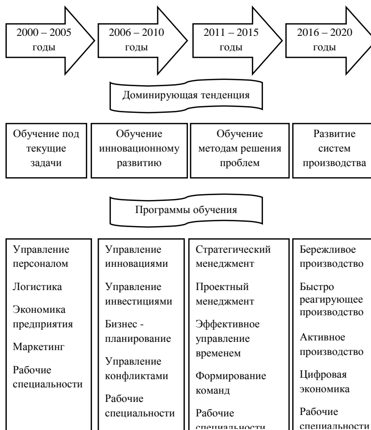
Рис. 1. Этапы развития системы корпоративного обучения персонала на предприятиях Пермского края

выступают изменения, происходящие в системе корпоративного обучения персонала предприятий в условиях реализации масштабных проектов, направленных на достижение целевых показателей роста производительности труда.