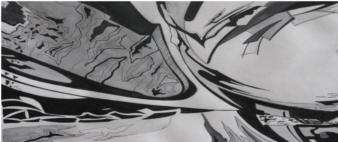
Рис. 2. Эмоциональная передача музыки через пятна и линии. Динамика

яркостью, нарядностью и эмоциональностью. Цвет может радовать, а иногда создавать тревогу, напряжение и раздражение. Есть цвета успокаивающие и раздражающие нервную систему. Зеленый, голубой, синий – действуют успокаивающе. Красный, пурпурный, желтый и оранжевый – цвета возбуждающие. Желтый цвет – радости и богатства золота, красный – обжигающий и энергичный, фиолетовый – беспокойный, зеленый – цвет равновесия и примирения, голубой – покоя и дали. Цвета делятся на теплые и холодные. Оранжевый, желтый и красный воспринимаются как теплые цвета. Фиолетовый и синий – как холодные. Зеленый цвет может быть и холодным и теплым.