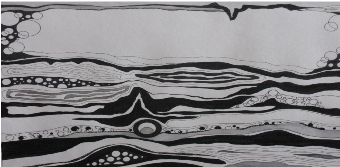
Рис. 3. Эмоциональная передача музыки через пятно и линию. Статика

Цвет – это большая часть нашего восприятия. В синтезе искусств важно, что цвет стимулирует креативность, как условие развития способностей [4].