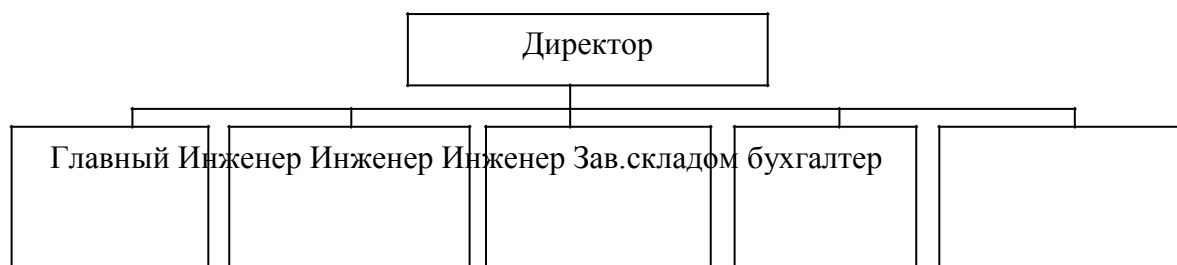
Рисунок 1 – Организационная структура общества

В рамках организационной структуры управления ООО «Бирские тепловые сети» осуществляется функции: решение целей и задач поставленных перед организацией (рисунок 1).