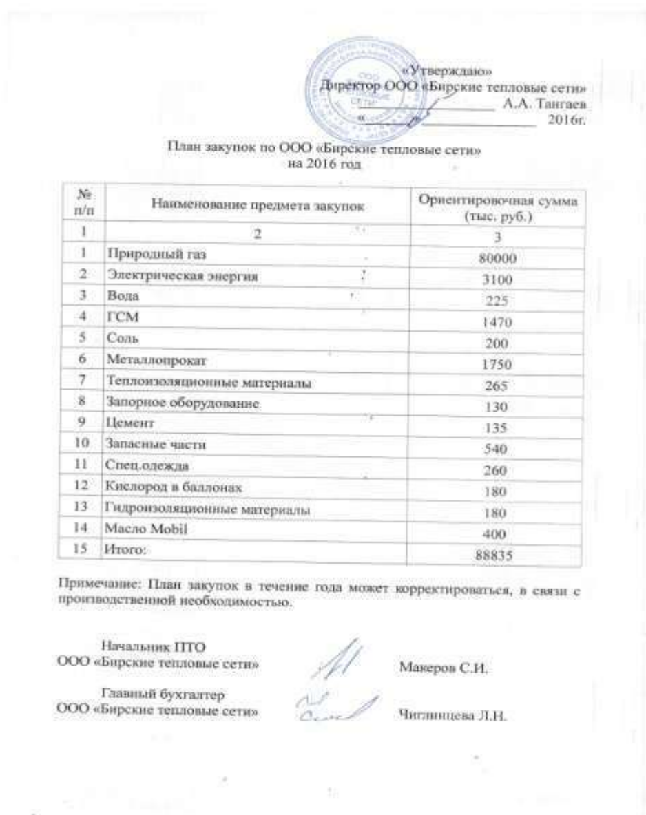
Рисунок 4 – План закупок ООО «Бирские тепловые сети» на 2016 год

нужд ООО «Бирские тепловые сети» во исполнение Федерального закона от 18.07.2011 №223–ФЗ «О закупках товаров, работ, услуг отдельными видами юридических лиц». Положение определяет четкий регламент ведения закупочной деятельности на основании плана закупок. На каждый календарный год, на основе финансово-хозяйственного плана составляется план закупок, в который в случае необходимости вносятся изменения (рисунок 4).