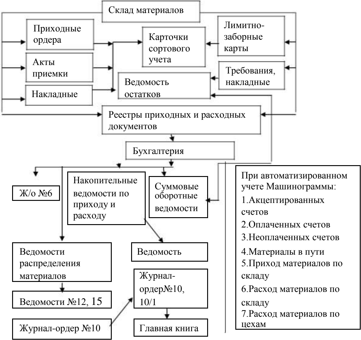
Рисунок 5 – Схема учета материалов в ООО «Бирские тепловые сети»

В учреждении ООО «Бирские тепловые сети» ведется аналитический и синтетический учет материалов, согласно действующего законодательства. Аналитический учет в учреждении представляет собой количественно – суммовой учет. Синтетический учет осуществляется в суммовом значении. Синтетический учет в учреждении ведется в бухгалтерском учете, это что называется суммовой учет. Аналитический учет материальных запасов в учреждении ведется на аналитических счетах. Схема учета материальных запасов в ООО «Бирские тепловые сети» обозначена на рисунке 5.