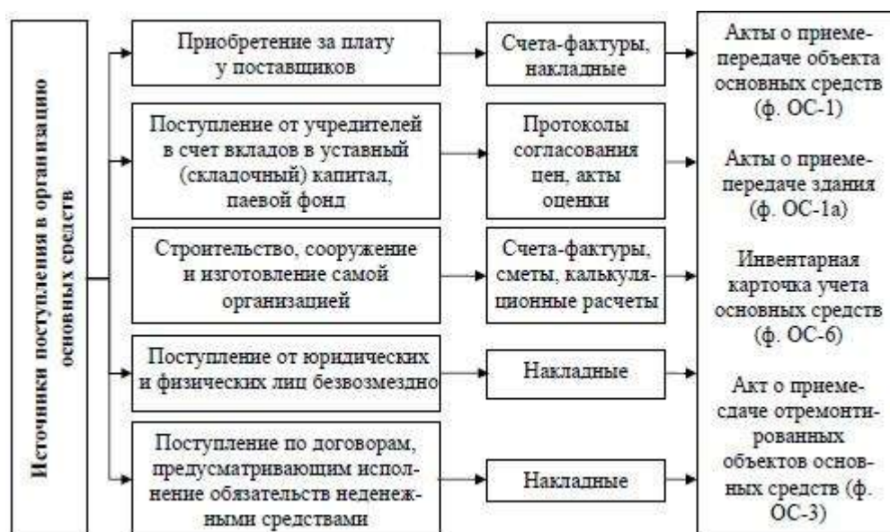
Рисунок 5 – Источники поступления основных средств

К видам источникам поступления основных средств в ООО «Клиникзет» относиться только приобретение за собственные средства, т.е. покупка.