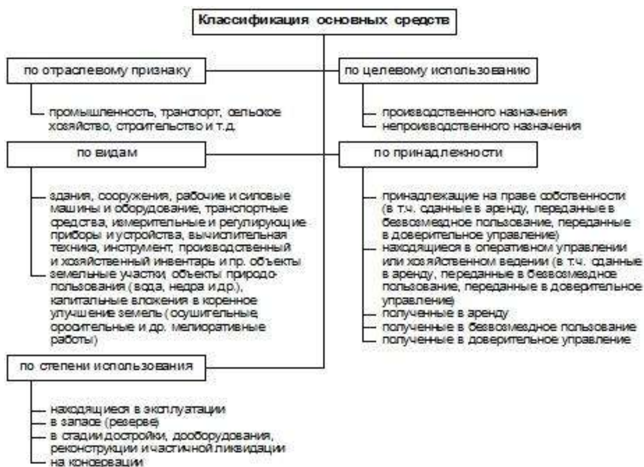
Рисунок 4 – Классификация основных средств