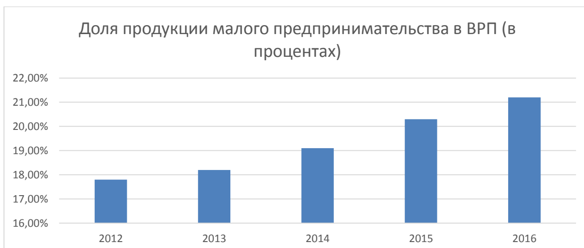
Рисунок 6 – Доля продукции малого предпринимательства в ВРП (в процентах)