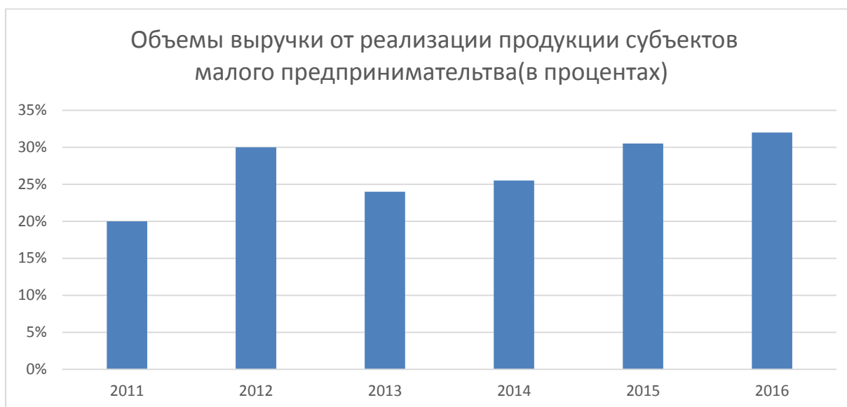
Рисунок 3 – Объемы выручки от реализации продукции субъектов малого предпринимательства (в процентах)