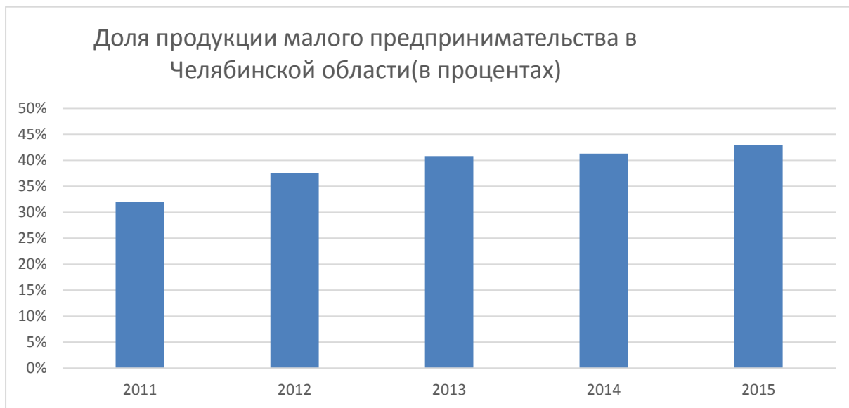
Рисунок 2 – Доля продукции малого предпринимательства в челябинской области (в процентах)