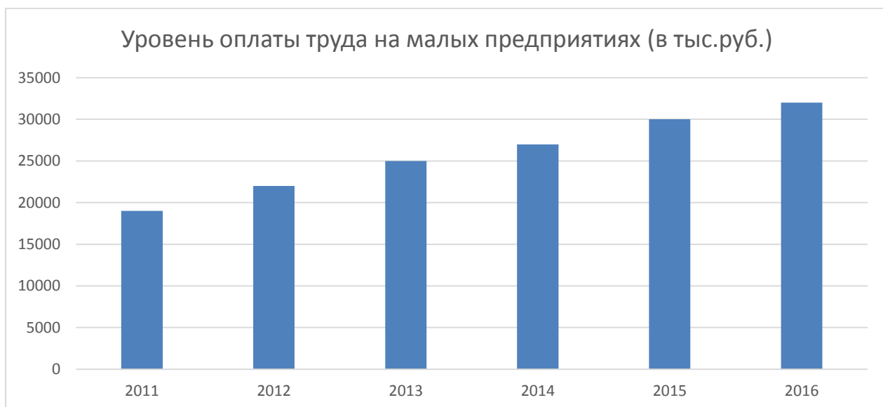
Рисунок 8 – Уровень оплаты труда на малых предприятиях (в тыс.руб.)

Анализируя деятельность малых предприятий в разных странах, можно проследить следующие этапы: