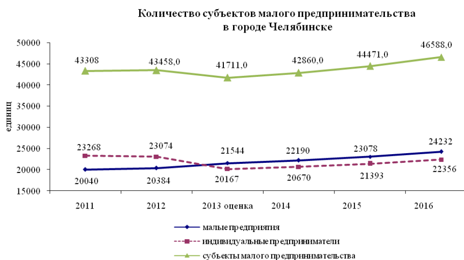
Рисунок 1 – Количество субъектов малого предпринимательства в городе Челябинске

Необходимость поддержки субъектов малого и среднего предпринимательства связана также с компенсацией неравных условий, в которых они находятся по сравнению с крупными предприятиями. Развитие предпринимательства, особенно в сфере производства и инновационной деятельности, имея значительный потенциал, осуществляется лишь при условии целенаправленного содействия со стороны всех организаций, образующих инфраструктуру поддержки предпринимательства.