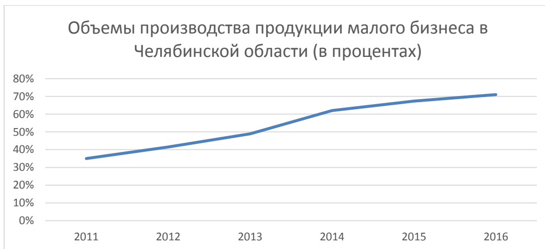
Рисунок 4 – Объемы производства продукции малого бизнеса в Челябинской области (в процентах)