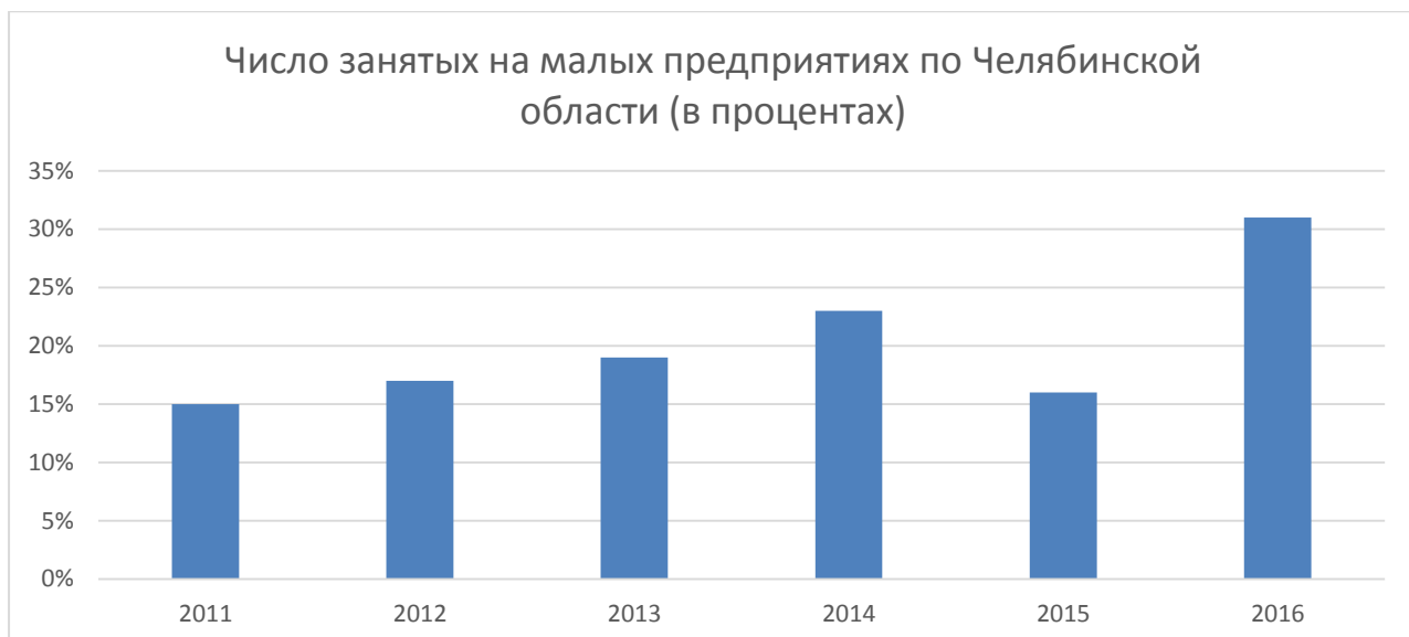
Рисунок 7 – Число занятых на малых предприятиях по Челябинской области (в процентах)