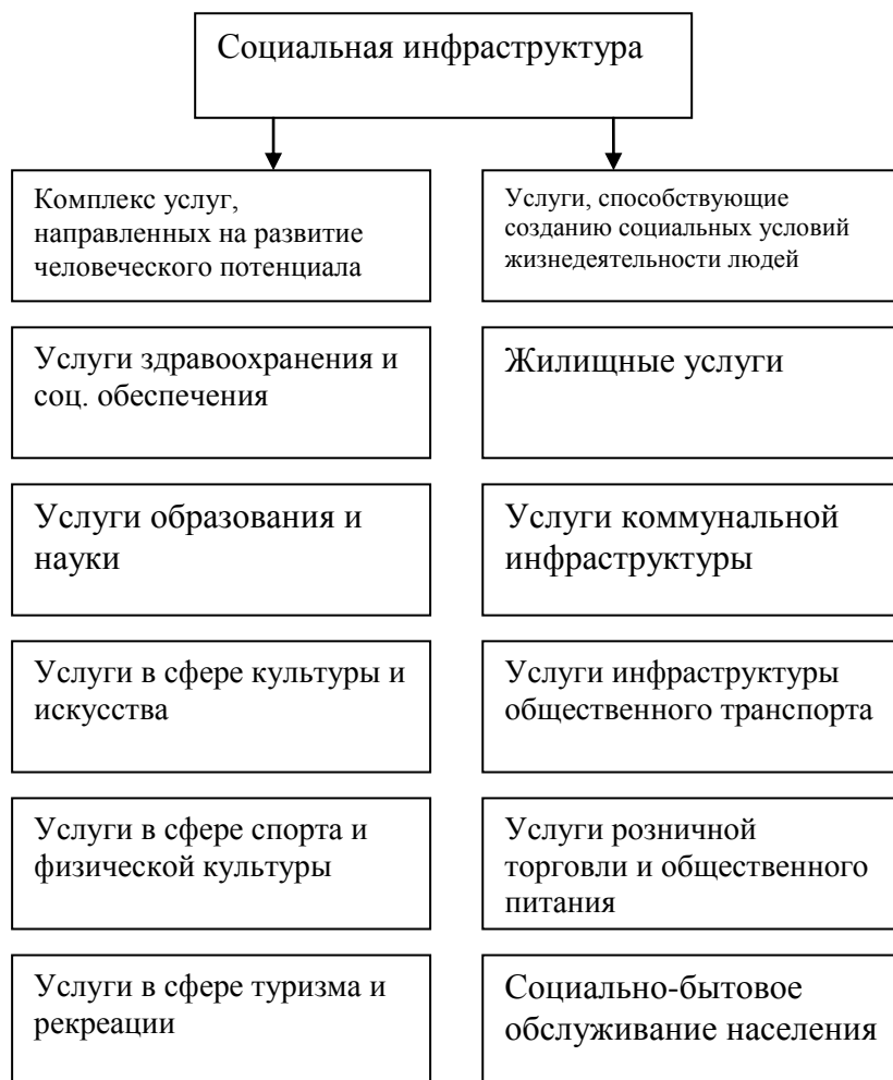
Рисунок 2 - структура социальной инфраструктуры

Рассмотренные сферы социальной инфраструктуры имеют как организационное подкрепление, так и юридическое: в их структуре находится материально-вещественное выражение в виде комплекса различных строений, сооружений, специализированных зон и участков, коммуникаций, сетей и т.п., сооружений для полноценного осуществления своей основной социальной функции. Итак, подводя итог, социальная инфраструктура предполагает собой рационально сформированную материально пространственную сферу, необходимым требованием существования которой является максимальная доступность и пространственно-временная приближенность её областей к сферам социальной и индивидуальной активности человека.