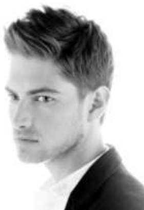
Рисунок 2.5 – Укладка волос

Популярны укладки и с небольшими завитками, которые создаются при помощи щипцов. Укладка прекрасно уместна для торжественных мероприятий. [20] Укладка волос предоставляется на рисунке 2.5.