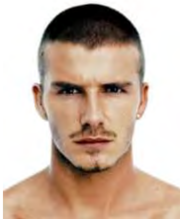
Рисунок 2.2 – Стрижка машинкой

Спортивные прически уже давно носят не только спортсмены. Они подходят к любой одежде, будь то повседневный или деловой костюм. Их отличает небольшая длина волос по всей голове с объемом наверху. Возрастных ограничений для такой прически также нет. [11] Спортивная стрижка, по-другому называется «Стрижка машинкой» и представлена на рисунке 2.2.