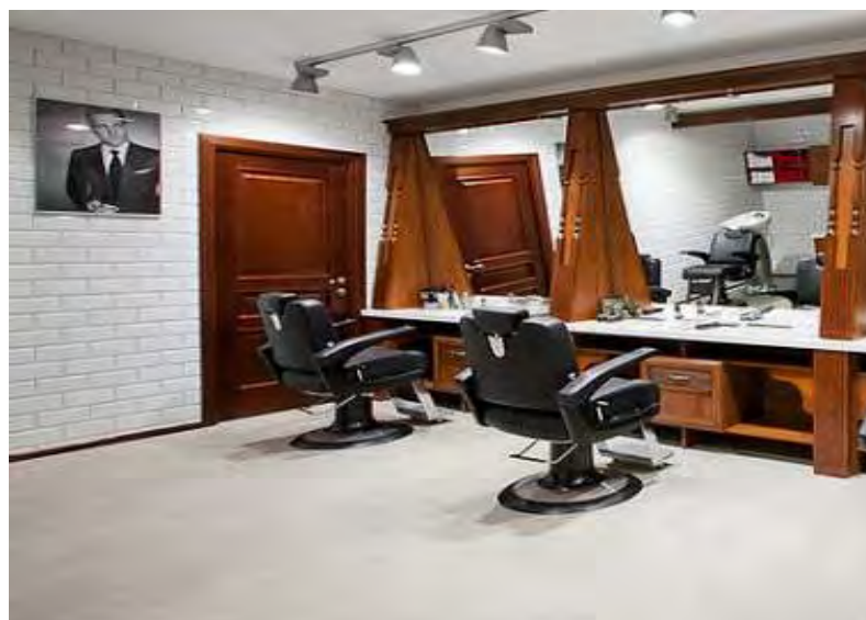
Рисунок 1.1 – Оснащение Барбершопа

Примеры оснащения Барбершопа на рисунках 1.1 и 1.2.