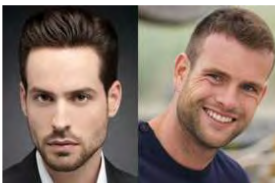
Рисунок 2.1 – Мужская стрижка

Классические стрижки характеризуются четкой геометрией линий. Длина волос при этом обычно не более 3-5 см. Подобные укладки предполагают гладко зачесанную шевелюру с пробором или без него. Они требуют минимального ухода и никогда не теряют актуальности. [11] Данная стрижка показана на рисунке 2.1.