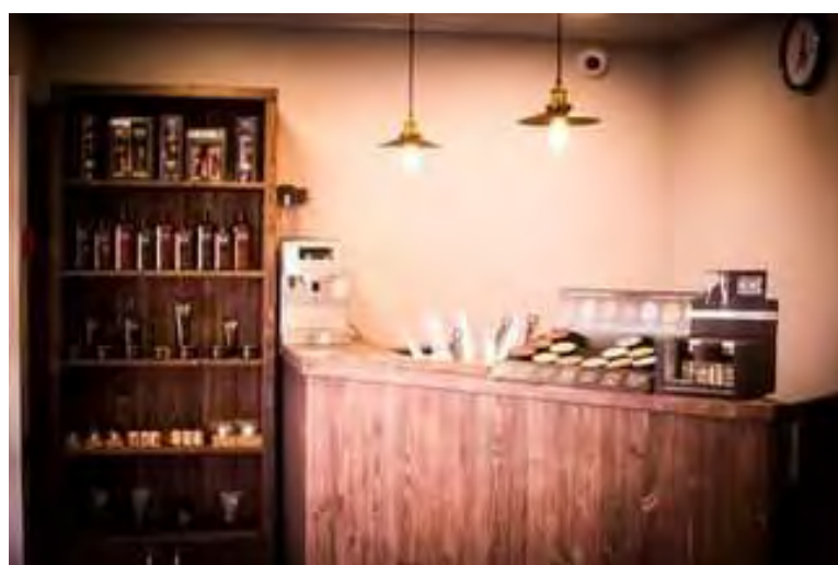
Рисунок 1.2 – Оснащение Барбершопа