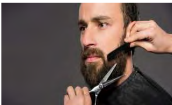
Рисунок 2.3 – Стрижка усов и бороды

фессионалам в надежде изменить свой имидж. Это касается не только внешнего вида, дизайна одежды и стрижек, но бороды и усов в том числе. Очень важно понимать всем тем, кто хотел бы носить бороду и усы – она подходит не для каждого типа лица, поэтому для себя нужно подобрать определенную форму. Немаловажное значение имеет и густота щетины. [18] Стрижка усов и бороды предоставляется на рисунке 2.3.