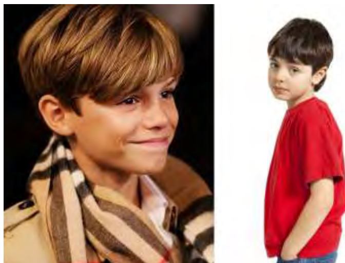
Рисунок 2.7 – Детская стрижка

Основная тенденция – это четкие линии, которые делят верх и низ стрижки. 2017 год можно с уверенностью назвать эпохой асимметрии. Рваный, косой край «преследует» модников везде. Не остались в стороне и прически для мальчиков. [14] Детские стрижки предоставлены на рисунке 2.7.