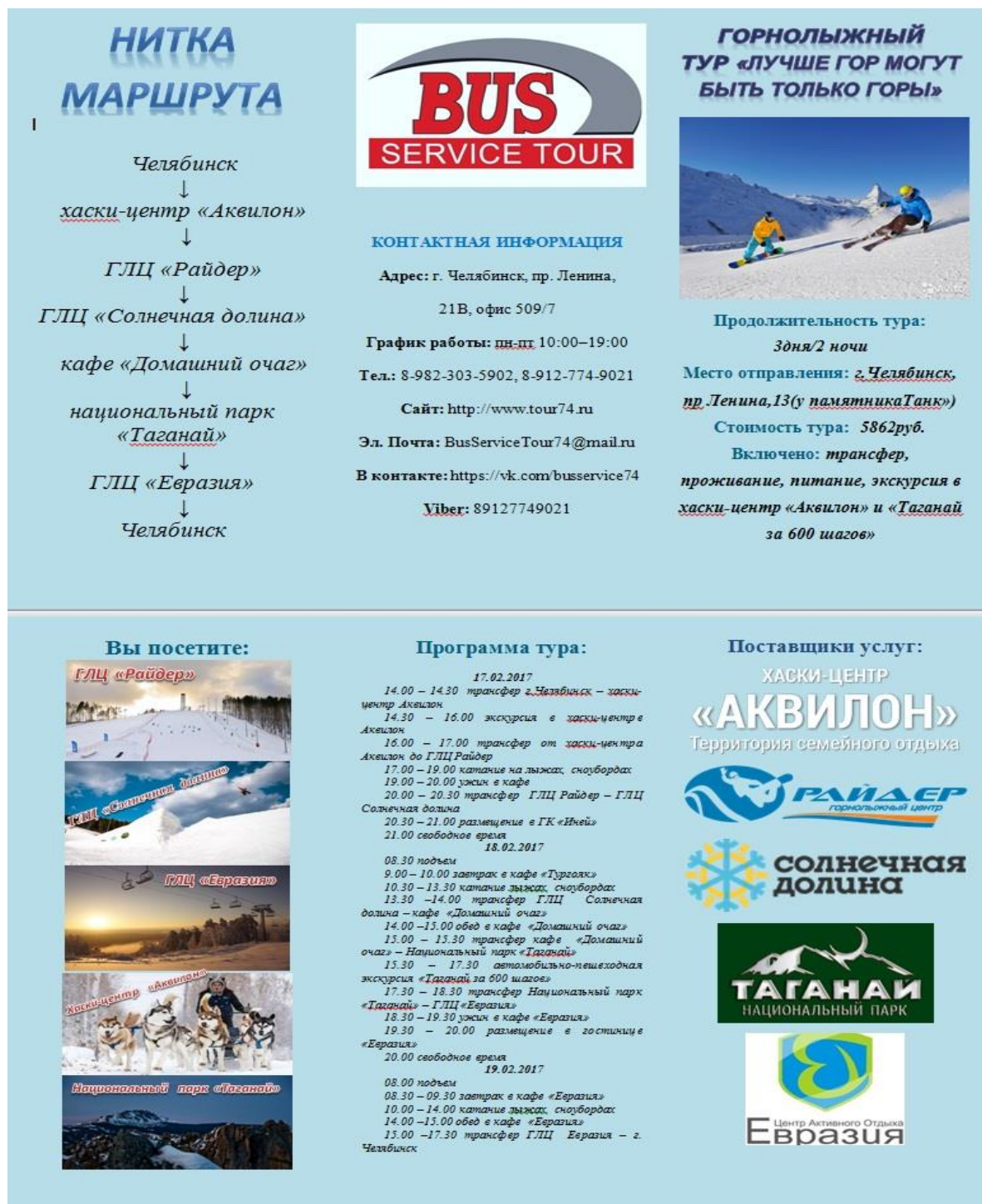
Рисунок А.1 – Буклет по туру