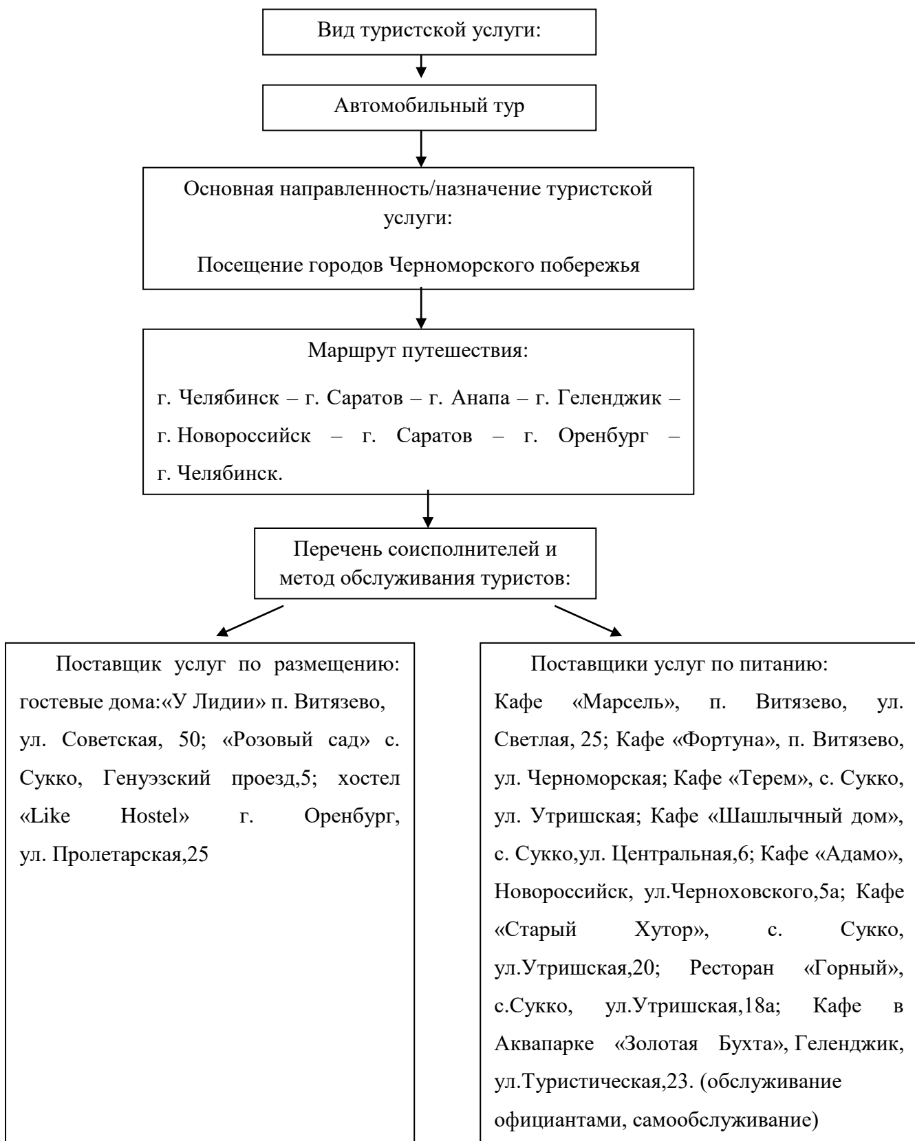
Рисунок 1.1 – Проектирование модели автомобильного тура в Анапу