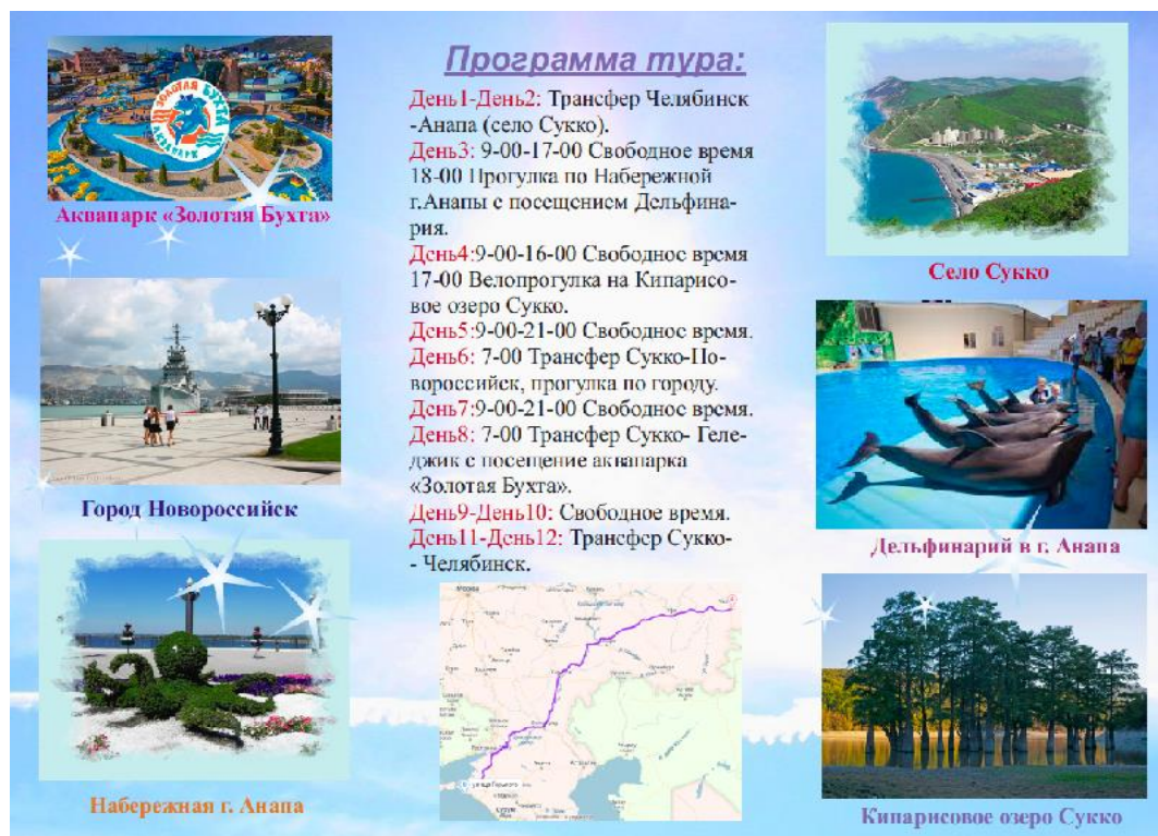
Рисунок Г. 2 – Вторая сторона буклета