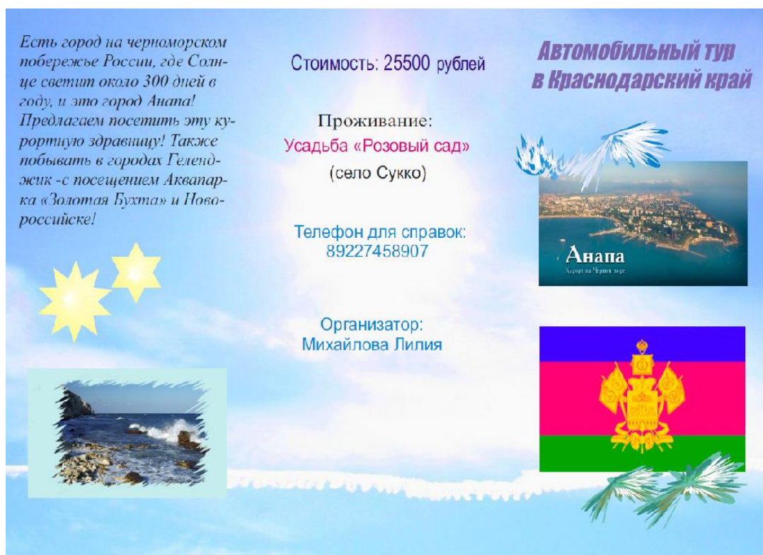
Рисунок Г. 1 – Первая сторона буклета