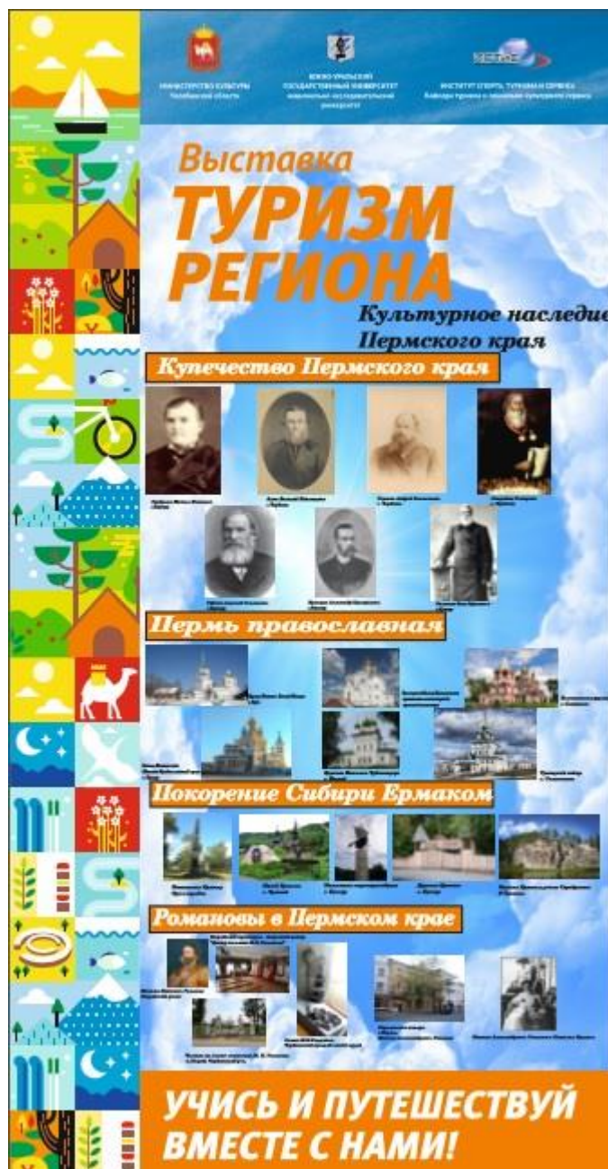
Рисунок В.4 – Баннер