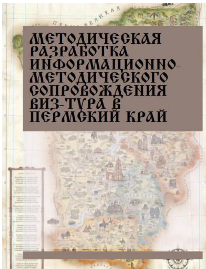
Рисунок Б.1 – МЕТОДИЧЕСКАЯ РАЗРАБОТКА ИНФОРМАЦИОННО-МЕТОДИЧЕСКОГО СОПРОВОЖДЕНИЯ ВИЗ-ТУРА В ПЕРМСКИЙ КРАЙ