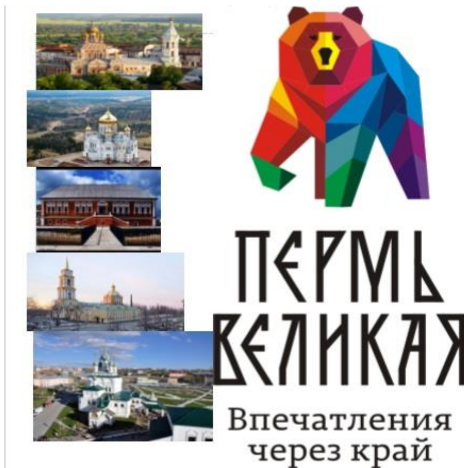
Рисунок В.3 – Листовка