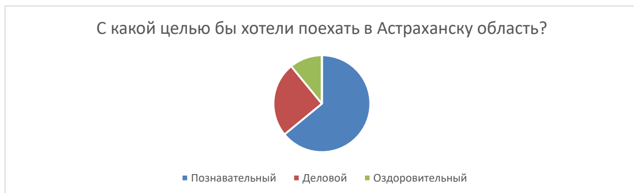
Рисунок 1. Опрос

По итогам анкетирования основным сегментом стала возрастная группа от 22–45 лет. Именно на этот возраст и будет нацелен новый турпродукт в Астраханскую область. Так же исходя из анкетирования наибольшее предпочтение у потребителей вызывает продолжительность тура – 10 – 14 дней.