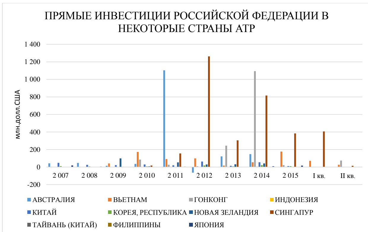
Рис.3. Прямые инвестиции Российской Федерации в некоторые страны АТР за период с 2007 по 1 кв.-2 кв.2016г.

Наша страна оказывает открытую поддержку по созданию зоны свободной от ядерного оружия в Юго-Восточной Азии с целью достижение более стабильного и безопасного уровня; заключает соглашения с азиатскими державами по поводу экономического сотрудничества, но, если смотреть политику инвестирования, можно сделать вывод, что даже несколько лет назад Россия инвестировала в страны АТР куда больше, чем может это позволить себе сейчас (См.Рис.3).