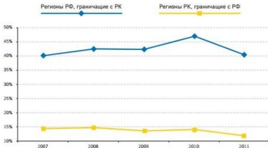
Рисунок А1 - Внешнеторговый оборот российского и казахстанского приграничья, % к национальному показателю соответствующей страны