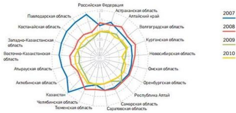
Рисунок А4 - Индекс потребительских цен (декабрь к декабрю предыдущего года, %)