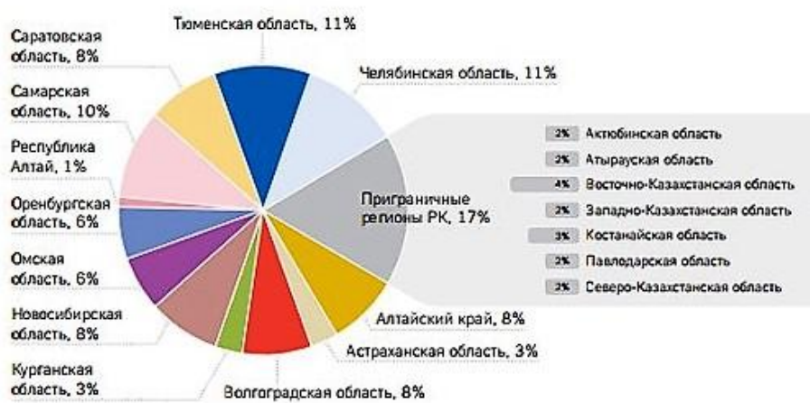
Рисунок А2 - Распределение населения между приграничными регионами Российской Федерации и Республики Казахстан (на начало 2012 г.)