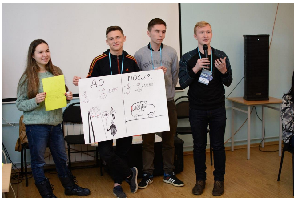
Рисунок 8 – Мероприятие в большой зале на базе отдыха «Непряхино»

последние дни августа для адаптационных курсов, направленных на вовлечение нынешних студентов первого курса в новую жизнь. Высшая школа экономики и управления Южно-Уральского государственного университета имеет опыт проведения выездной школы молодого ученого «Вектор» для групп элитной подготовки в осенний период. Программа семинара предусматривает использование не только действующих конференц-залов, но и основного здания столовой. Питание и проживание также было обеспечивается в круглогодичных корпусах. Также ежегодно проводится и осенний выездной уровень Школы молодого лидера «Дружи!» и осенняя школа Лиги КВН ЮУрГУ.