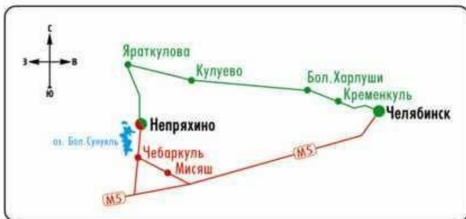
Рисунок 15 – Схема проезда до СОК «Непряхино»

3) На электричке до г. Чебаркуля, с ж/д вокзала г. Чебаркуля на специальном автобусе до с. Непряхино.