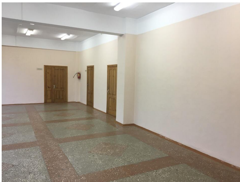
Рисунок 12 – Холл, вход в бильярдную комнату, администрацию и щитовую здания столовой базы отдыха «Наука»