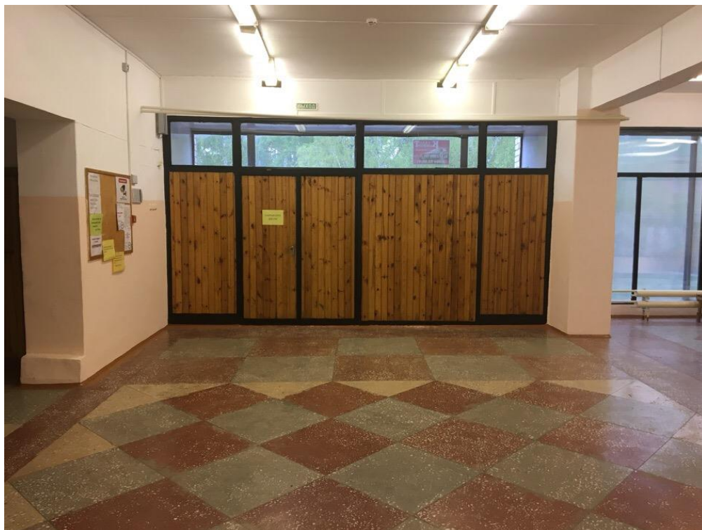
Рисунок 11 – Вход и коридор в здании столовой базы отдыха «Наука»