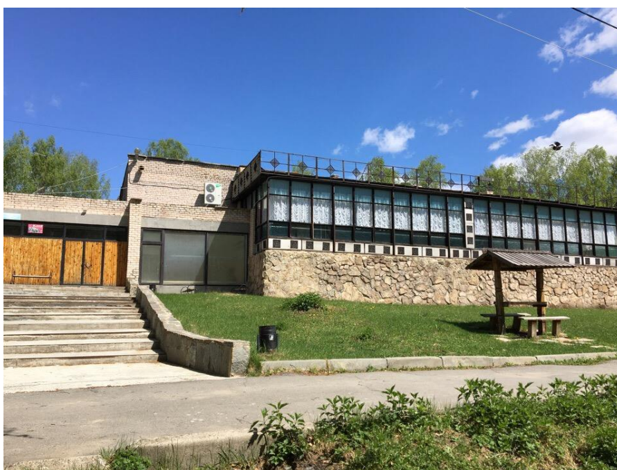
Рисунок 14 – Вид здания столовой базы отдыха «Наука» снаружи

Внутри столовой есть деление на два зала, один из которых является верандой, которую хорошо видно снаружи здания на рисунке 9.