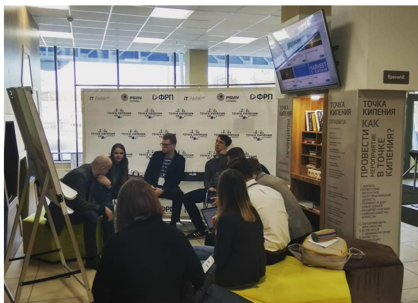
Рисунок 4 – Мастер-класс в лектории «ВремяЧЕ»

Лекторий «ВремяЧЕ», предназначенный для проведения лекций, мастер-классов, выставок на 15 посадочных мест. Пространство оснащено телевизорами, возможностью для зарядки устройств, библиотекой.