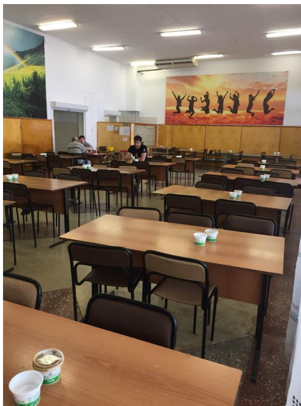
Рисунок 9 – Основной зал столовой

бильярдная комната, щитовая, библиотека, гардероб, туалетные комнаты. Основную площадь занимает столовая и производственные помещения столовой. На втором этаже небольшую площадь занимает буфет.