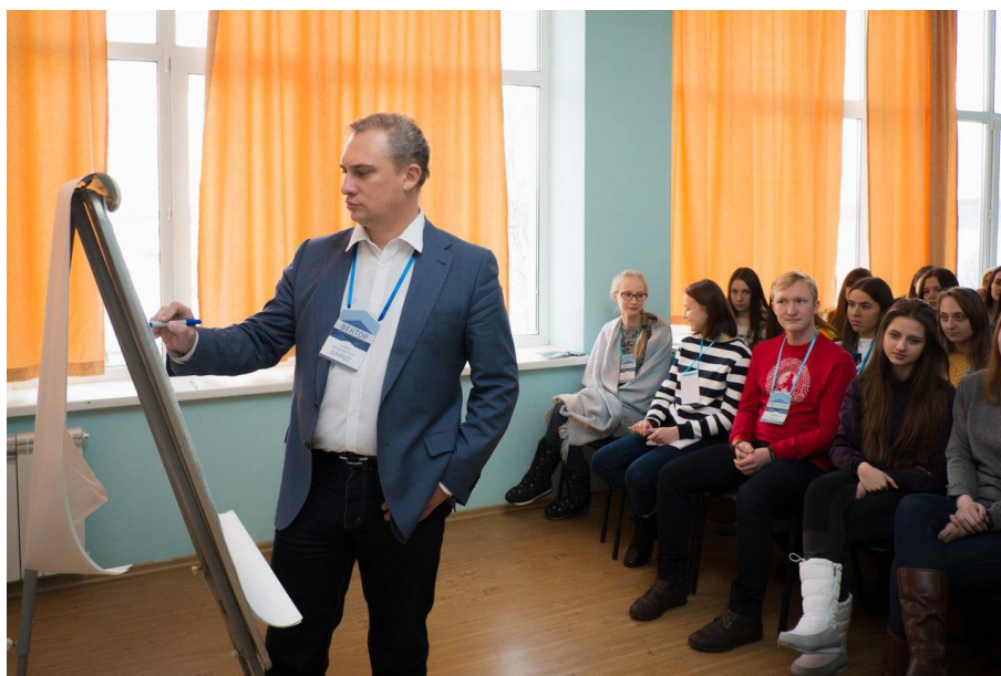
Рисунок 7 – Конференция в большом зале на базе отдыха «Наука»

Сейчас на территории базы в круглогодичных корпусах имеется два конференц-зала на 70 и 25 человек. Но для проведения масштабных мероприятий такого количества мест недостаточно и расположение залов в разных корпусах может осложнять проведение их параллельно.