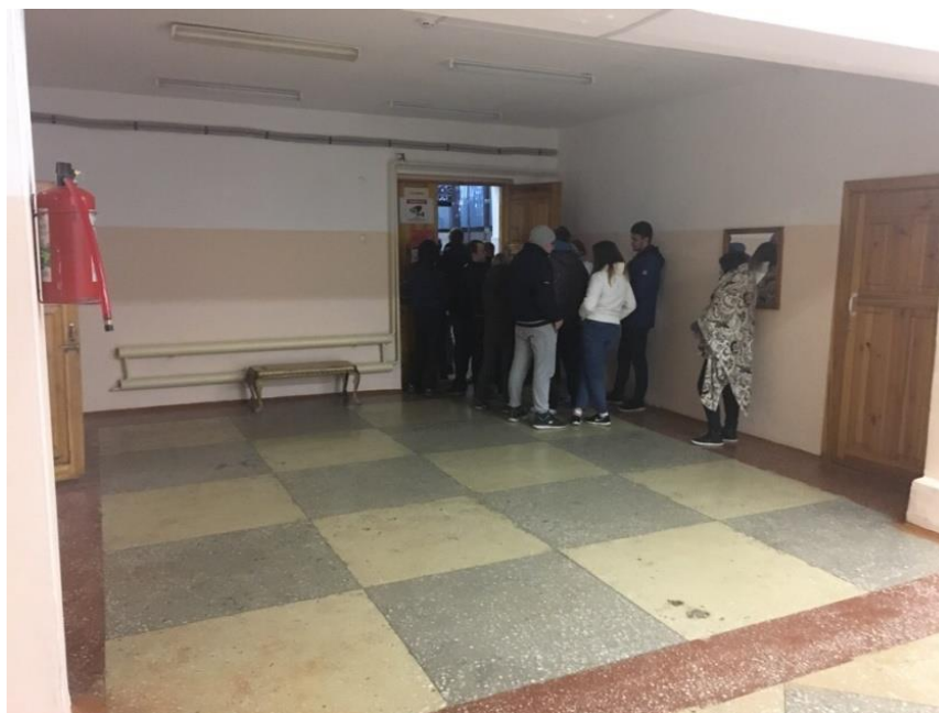
Рисунок 13 – Вход в столовую базы отдыха «Наука»

Внутри столовой есть деление на два зала, один из которых является верандой, которую хорошо видно снаружи здания на рисунке 9.