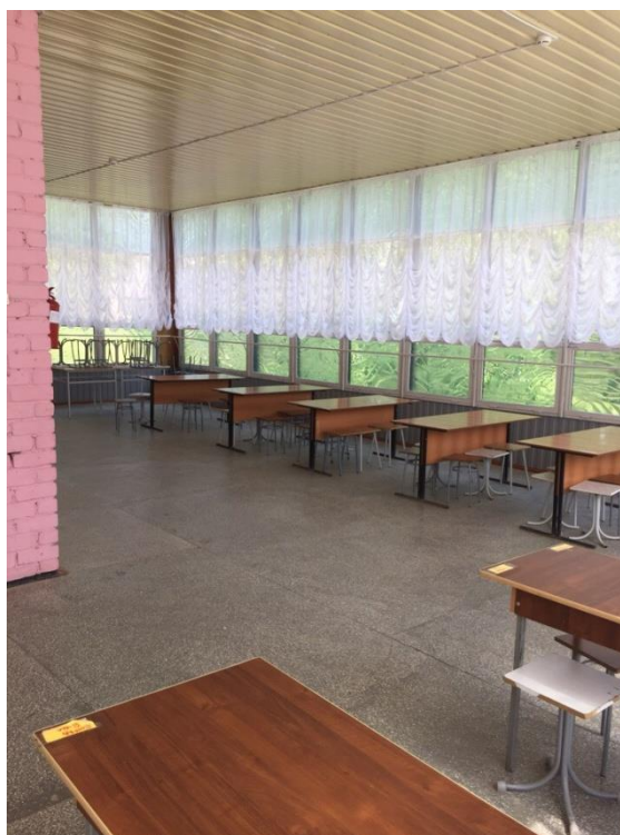
Рисунок 10 – Веранда основного зала столовой