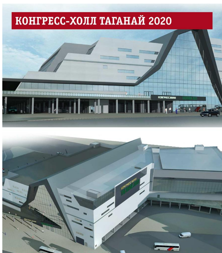
Рисунок 6 – Конгресс-холл «Таганай 2020»

Второе – объекты, связанные с проживанием гостей саммита. Базовая потребность в гостиничном фонде саммита – до 5000 номеров категории «3+», включая почти три десятка президентских номеров. На данном этапе, общая номерная емкость уже существующих челябинских гостиниц подобного класса – чуть меньше 4 тысяч номеров. Сейчас идет речь о возведении семи новых гостиниц, большая часть из которых – уже существующие недостроенные здания.