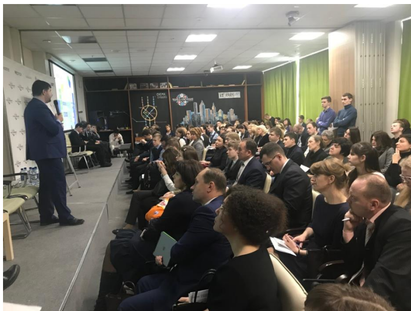
Рисунок 1 – Мероприятие в конференц-зале «КруЧе.net», «ПоЧему.net» Переговорная «Золотое сеЧение», предназначенная для деловых встреч, заседаний, подписаний документов вместимостью 15 человек. Имеется возможность вывода презентационных данных на плазменную панель, видеоконференцсвязи с удаленными участниками совещаний.