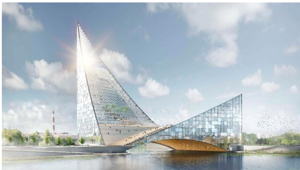
Рисунок 5 – Общественно-деловой центр на реке Миасс

Первое – ключевые объекты, которые напрямую связаны с проведением саммита: аэропорт, общественно-деловой центр на реке Миасс и «запасной» конгресс-холл на улице Труда, набережная реки Миасс и территория, прилегающая к ней и к зоне проведения саммита. Общественно-деловой центр на реке Миасс будет центральным объектом саммита, «Запасной» конгресс-холл на улице Труда является коммерческим проектом, который, с одной стороны, будет «страховать» работу основной площадки, а с другой – после завершения саммита он может быть реформатирован в то, что кажется наиболее выгодным его владельцу.