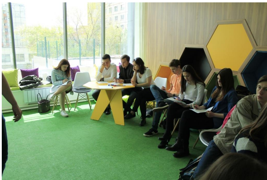
Рисунок 3 – Семинар в учебный класс «Чемпионика»

Лекторий «ВремяЧЕ», предназначенный для проведения лекций, мастер-классов, выставок на 15 посадочных мест. Пространство оснащено телевизорами, возможностью для зарядки устройств, библиотекой.