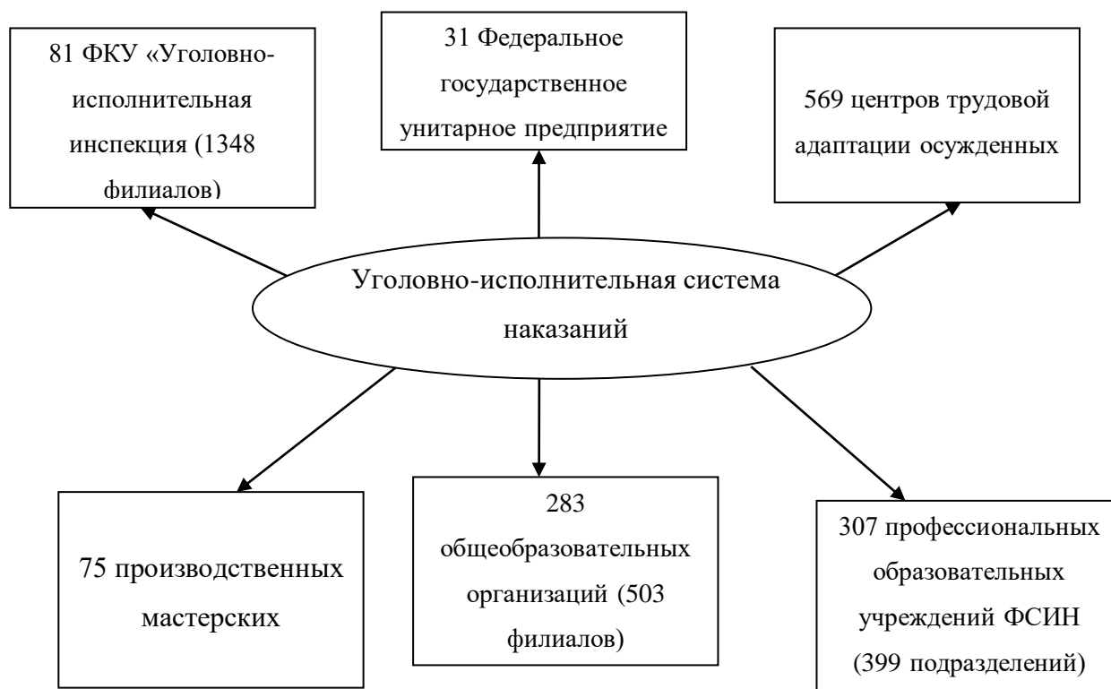
Рисунок 2.1 Структура уголовно-исполнительной системы наказаний

На сегодняшний день развитие уголовно-исполнительной системы продолжается, и представляет собой уже целый комплекс государственных учреждений и органов, исполняющих наказания, который можно представить в виде рисунка [96].