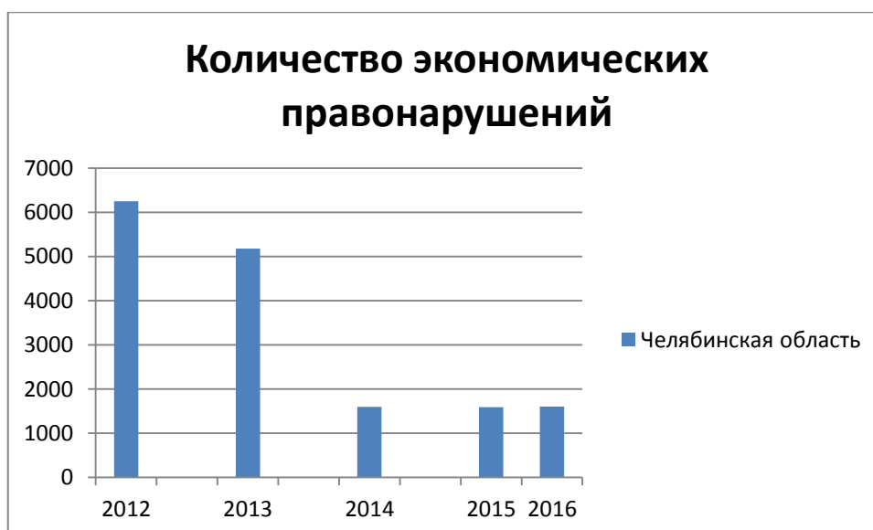
Рисунок 1- Количество экономических преступлений.

Таблица 2.2 Выявлено лиц, совершивших преступления экономической направленности с 2012 по 2016 гг.