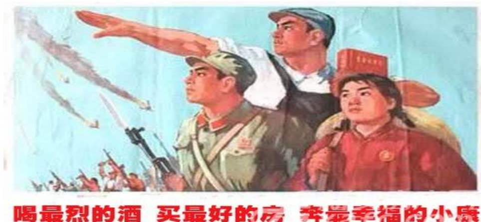
Рисунок 3. – Плакат «сяокан»

喝最烈的酒，奔最幸福的小康— Сяокан – это когда пьёшь крепчайшее вино, стремишься к зажиточной жизни (рисунок 3)