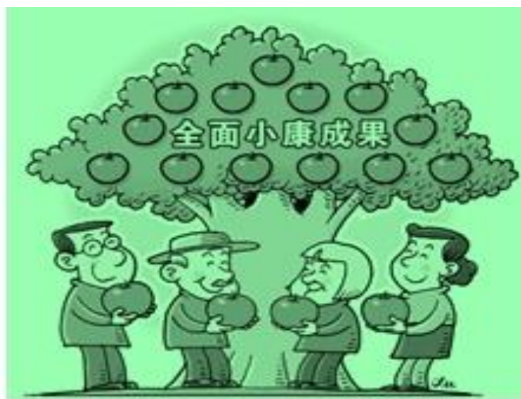
Рисунок 4. – Успехи абсолютного / полного сяокана

Ещё один характерный плакат о сяокане – «Успехи абсолютного/ полного сяокана» (рисунок 4). Мужчина средних лет, старик, пожилая женщина и женщина средних лет стоят под яблоней, на которой висят достаточно крупные яблоки и держат в руках по одному такому яблоку. Яблоко в Китае символизирует спокойствие, благополучие. По-китайски слово 苹果 – «яблоко» созвучно со словом 平安 – спокойствие. Содержание плаката наводит на мысль о том, что идея сяокан обеспечит людям спокойную жизнь.