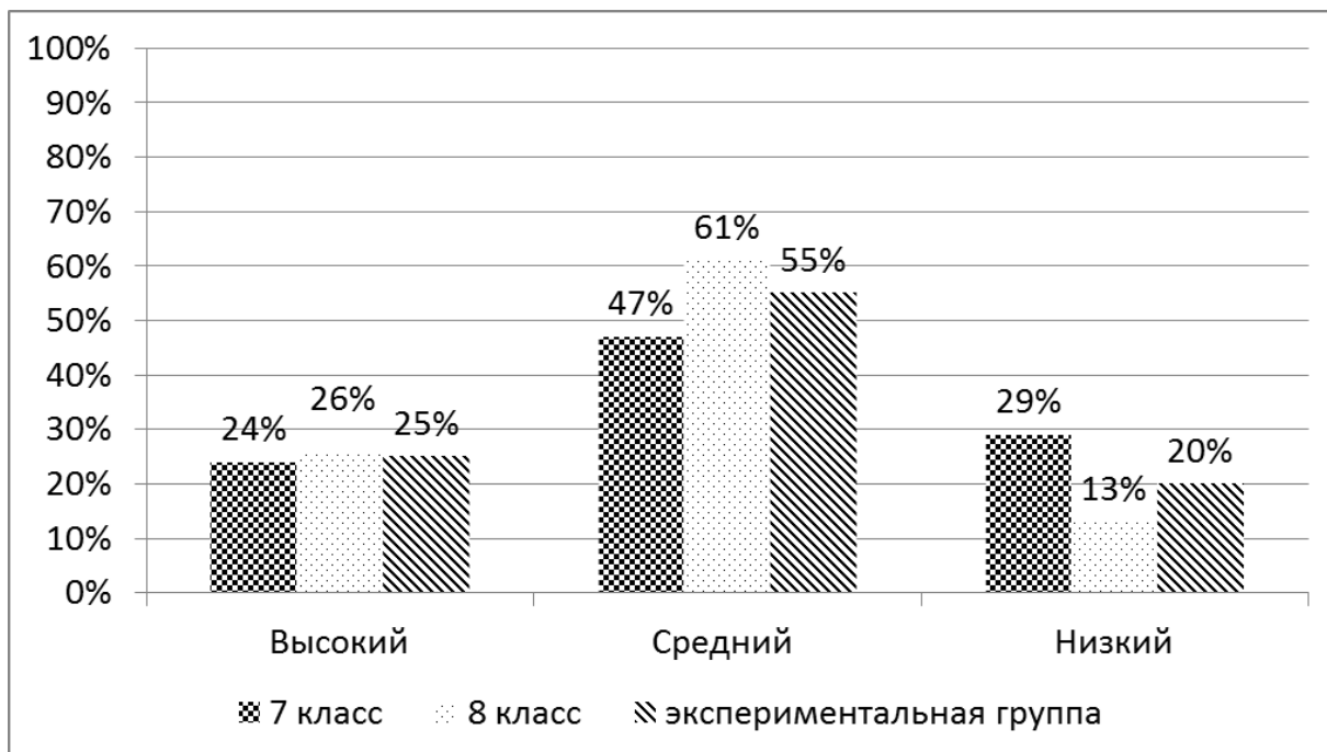
Рис. 1. Результаты исследования Интернет-зависимости подростков по методике «Шкала Интернет-зависимости» С.Х. Чена

В результате исследования было установлено, что у 11 подростков (25%) экспериментальной группы был выявлен высокий уровень Интернет-зависимости. Средний уровень Интернет-зависимости у той же группы обнаруживается у 24 подростков (55%). Низкий уровень Интернет-зависимости установлен у 9 подростков (20%).