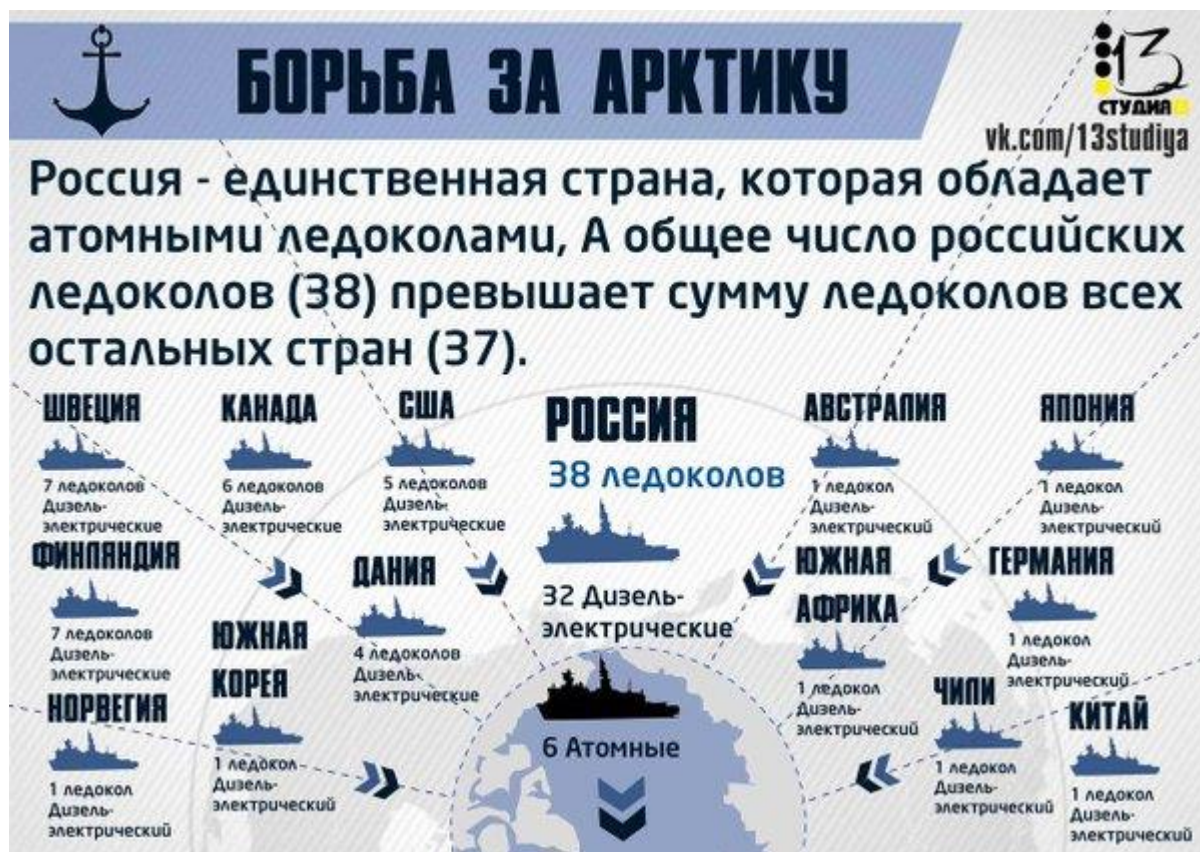
Рисунок В.1 – Количество ледоколов