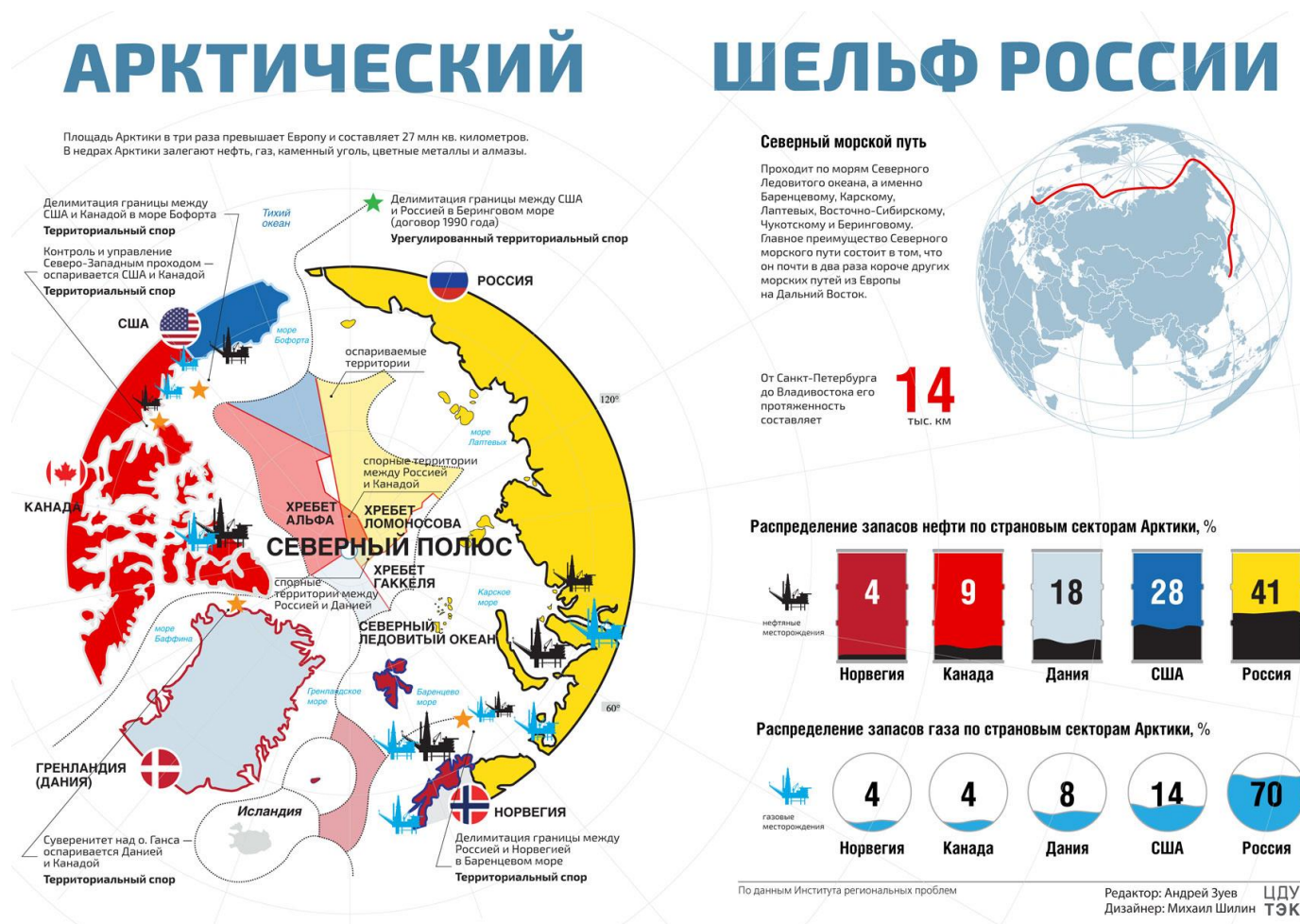
Рисунок Г.1 – Арктический шельф