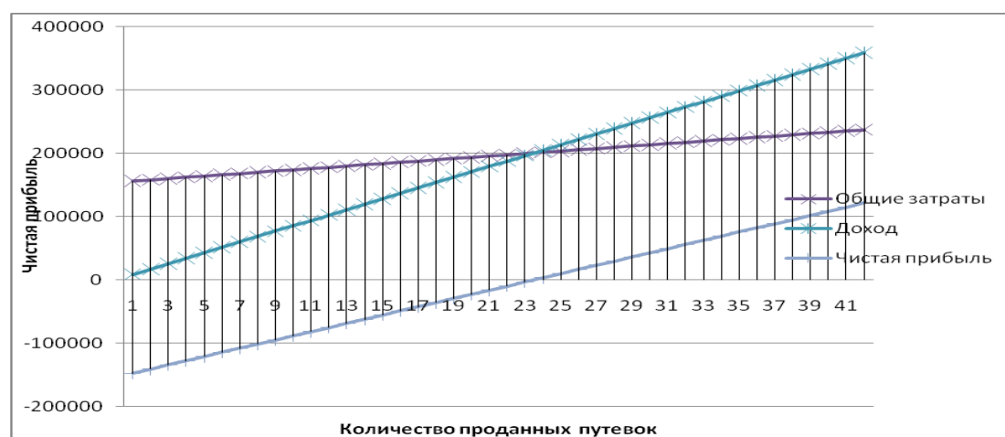
Рисунок 2 – Точка безубыточности

Графически точка безубыточности представлена на рисунке 1.