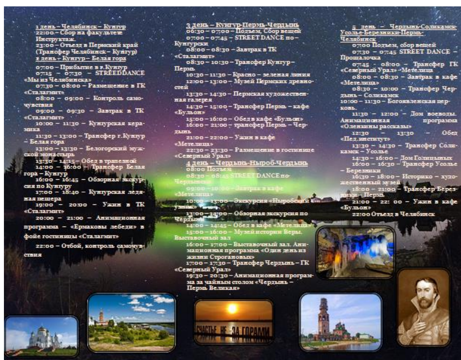
Рисунок Г.2 – Программа тура