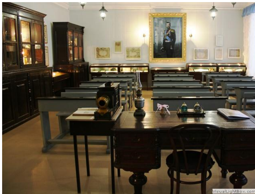
Рисунок Г.3 – Чердынский краеведческий музей. Гимназический класс.