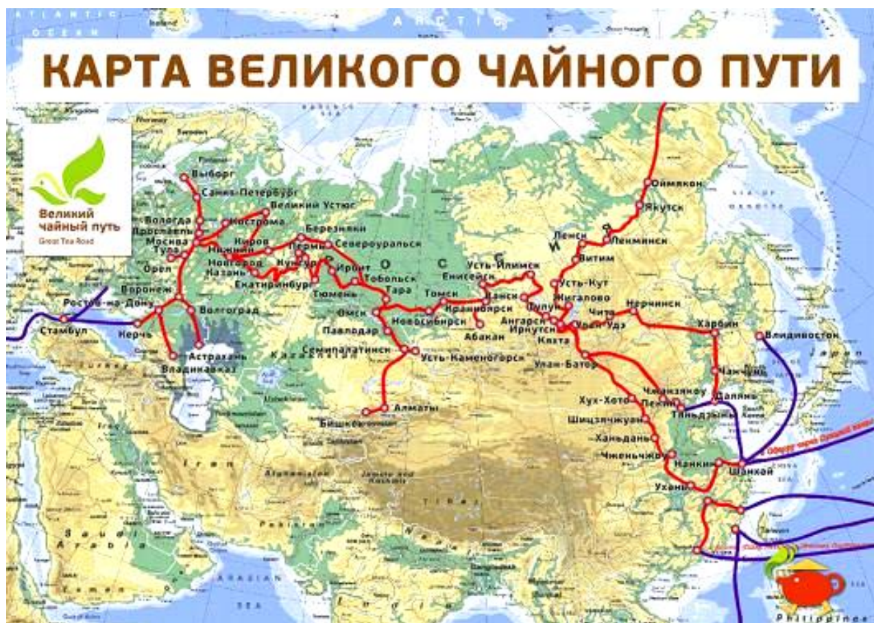
Рисунок 2 – Карта великого чайного пути