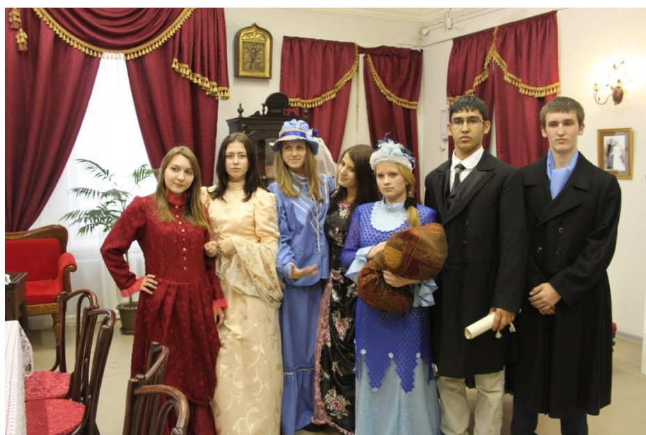
Рисунок Г.4 – Анимационная программа – «Один день из жизни Строгановых»