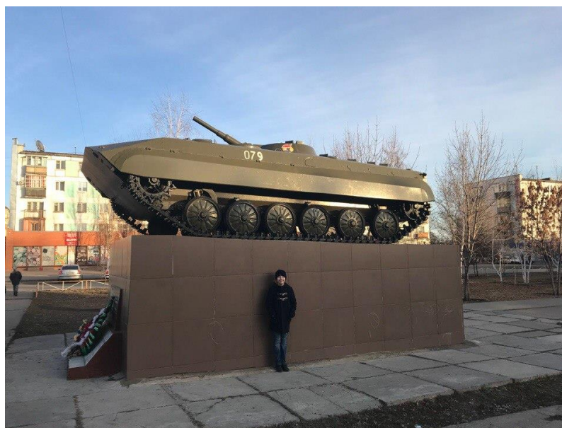
Рисунок Г.4 – Монумент «Танк»