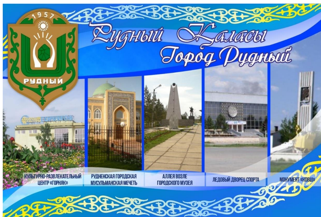
Рисунок В.1 – Баннер культурно-познавательного тура в г. Рудный