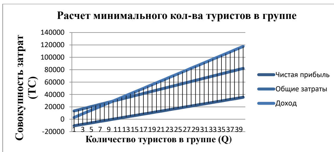
Рисунок 2.3.1 – Точка безубыточности культурно-познавательного тура в г. Рудный