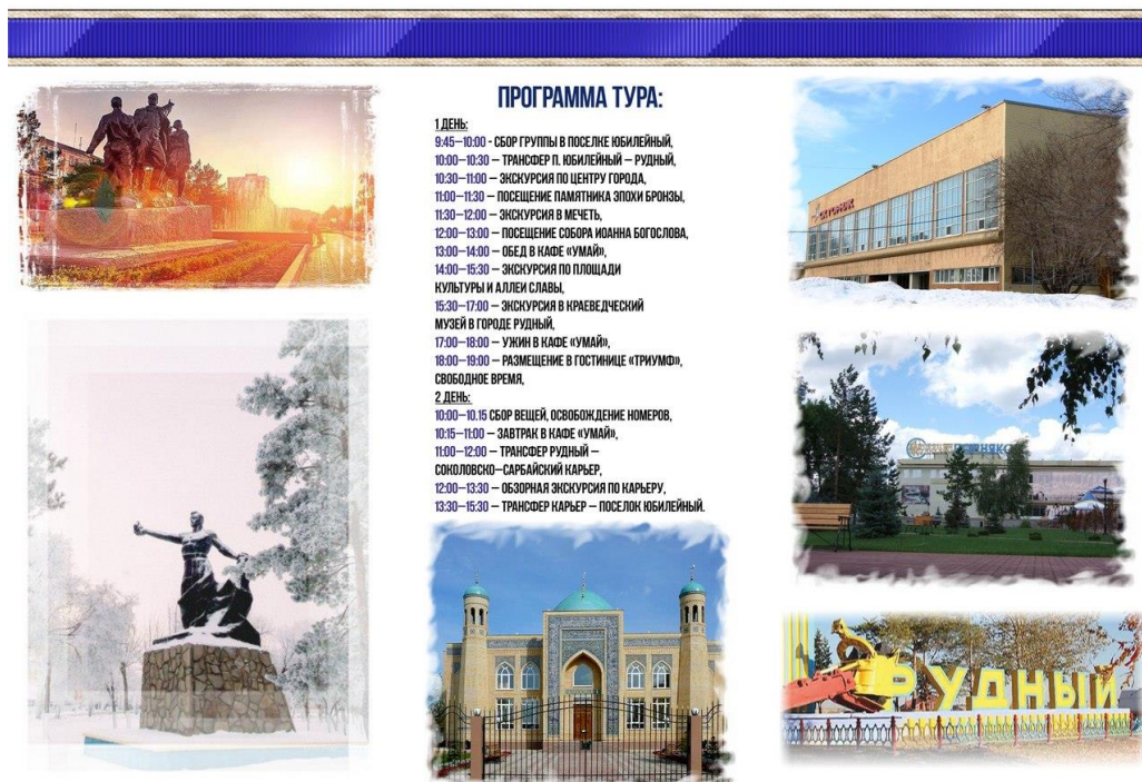
Рисунок В.3 – Буклет культурно-познавательного тура