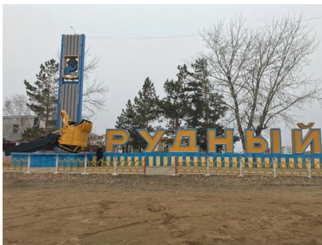
Рисунок Г.1 – Монумент Ковш