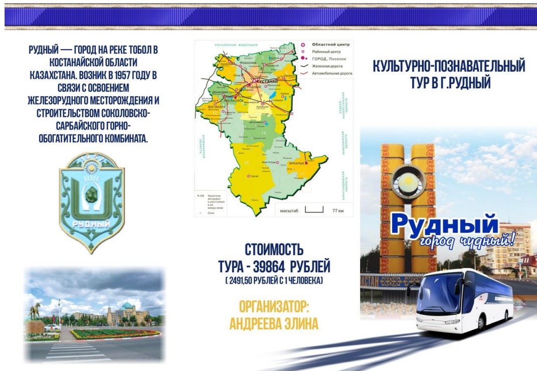
Рисунок В.2 – Буклет культурно-познавательного тура