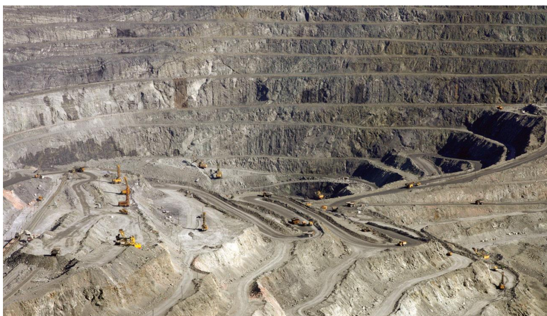
Рисунок Г.6 – Соколовско-Сарбайский горно-обогатительный карьер