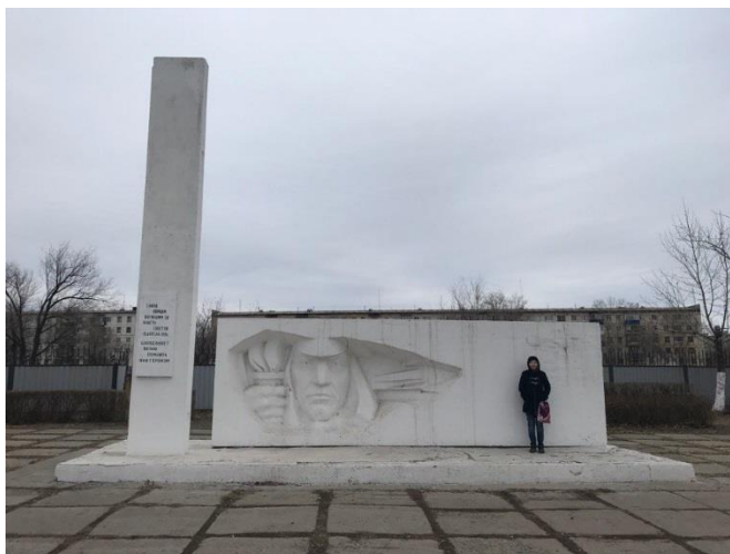
Рисунок Г.3 – Памятник Славы воинам Великой Отечественной войны