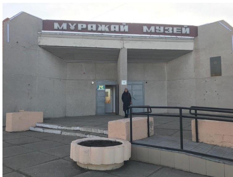
Рисунок Г.5 – Историко-Краеведческий музей города Рудный