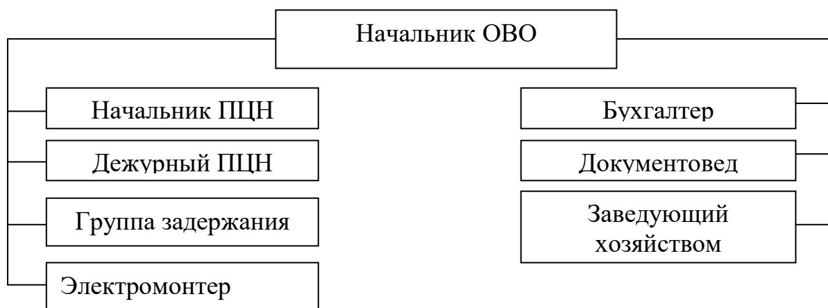
Рисунок 1 – Организационная структура управления Шумихинского ОВО-филиала ФГКУ «УВО ВНГ РФ по Курганской области»

Для выполнения задач по охране объектов используются группа задержания пункта централизованной охраны (ГЗ ПЦО) - наряд полиции, осуществляющий оперативное реагирование на сигналы тревоги из охраняемых объектов;