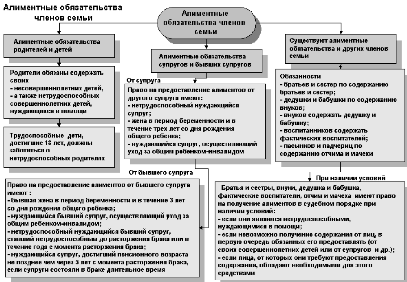
Рисунок А.2 – Алиментные обязательства членов семьи