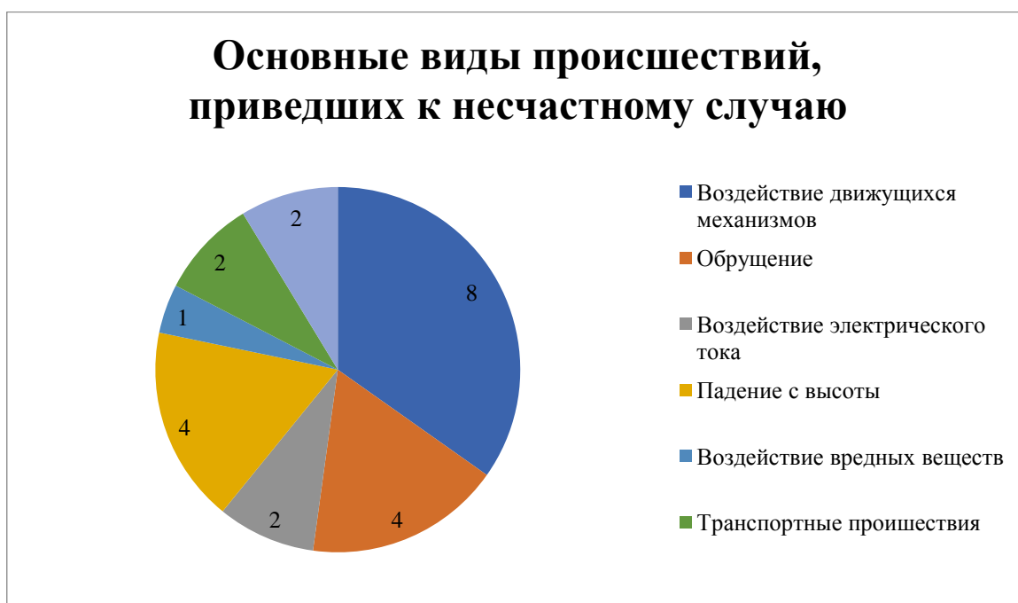
Диаграмма 2 – Основные виды происшествий, приведших к несчастному случаю

обрушение, обвалы предметов – 16% (4 погибших), падение с высоты – 16% (4 погибших), воздействие электрического тока – 8 % (2 погибших); Проиллюстрировано на диаграмме 2.