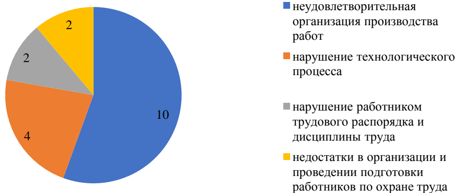
Диаграмма 3 – Основные причины происшествий, приведших к несчастному случаю со смертельным исходом

б) В разрезе отраслей экономики количество пострадавших со смертельным исходом за 2017 год составило следующую картину. Диаграмма 4.