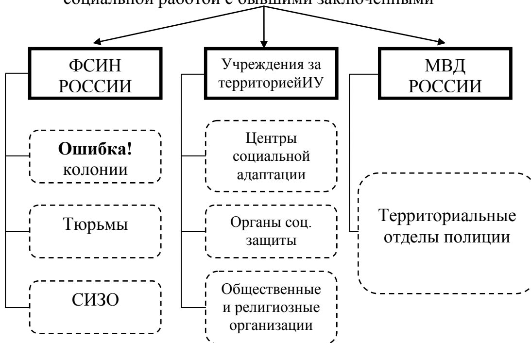
Рисунок 3 – Группы учреждений

Первой группой учреждений, занимающихся профилактической работой является Федеральная служба исполнения наказаний. Необходимо подробнее