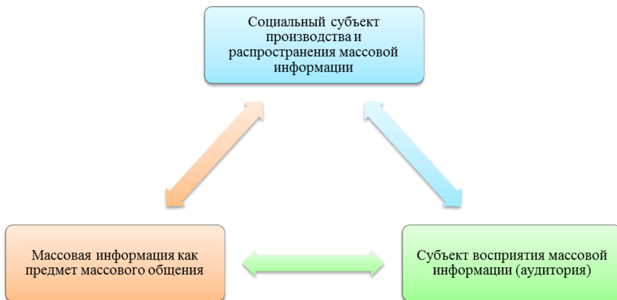
Рисунок 2 – Модель функционирования СМИ в современном обществе 30

В самом общем виде модель функционирования СМИ включает в себя три необходимые компонента, соединенных по принципу прямой и обратной связи (см. рисунок 2).