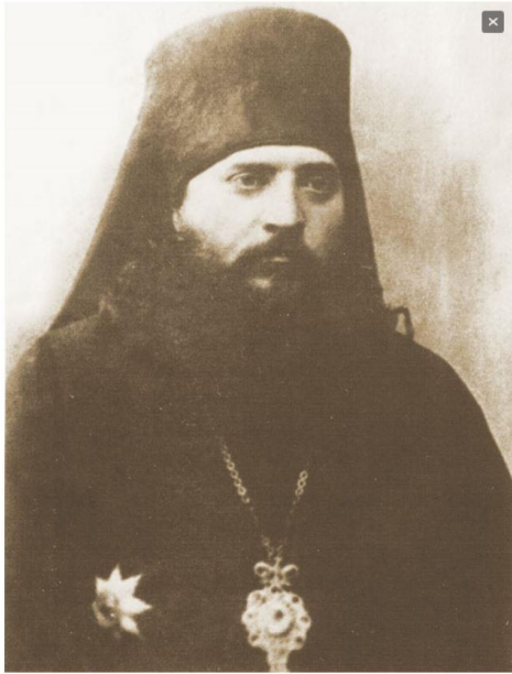
Епископ Оренбургский и Тургайский Феодосий