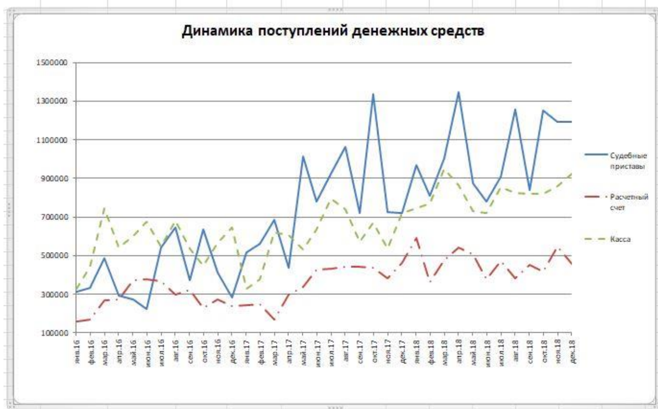
Рисунок 5 – Общая динамика поступления денежных средств по мероприятиям, проводимых ОАО «Миассводоканал» для уменьшения дебиторской задолженности за 2016–2018 гг.