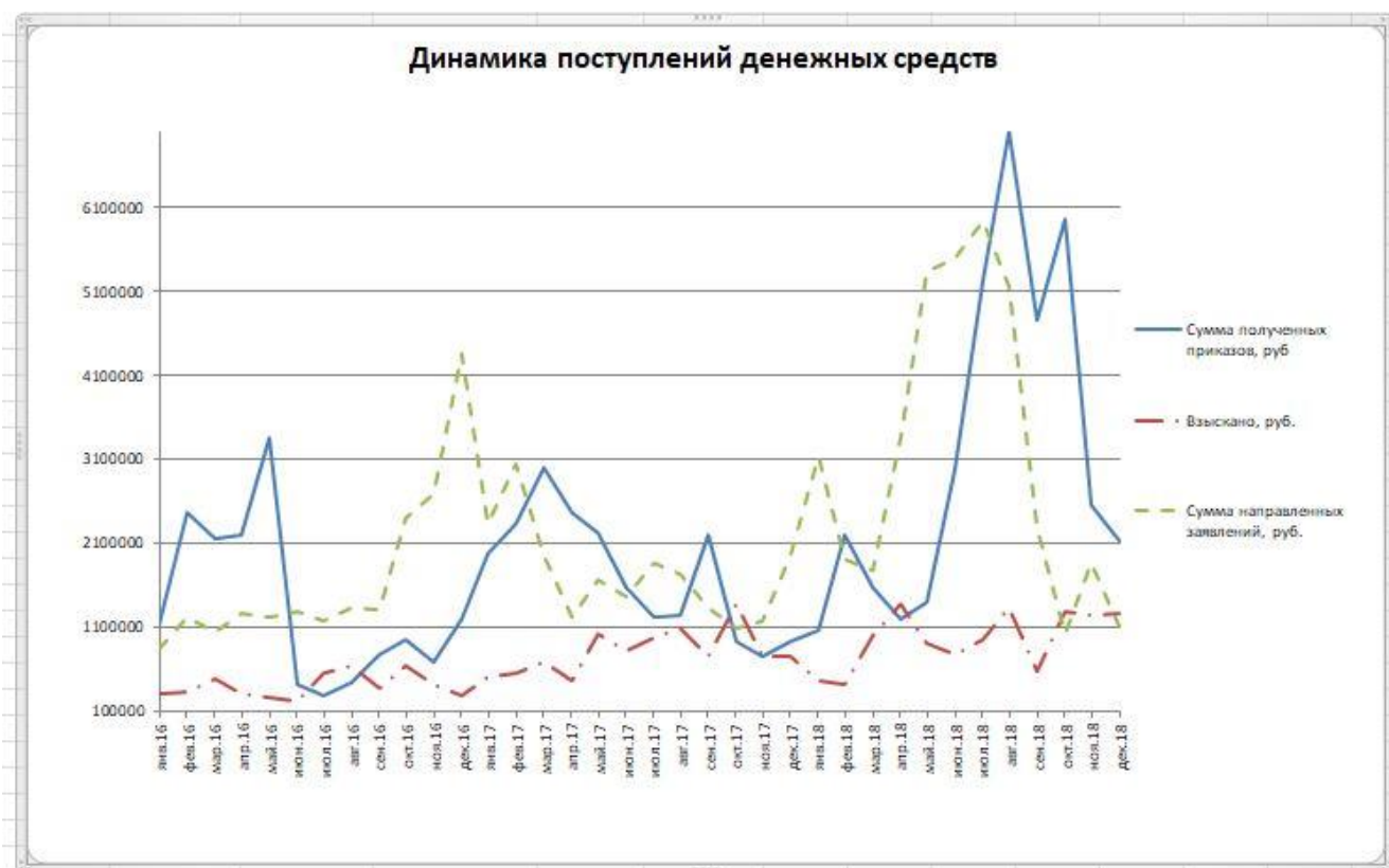
Рисунок 4 – Динамика поступления денежных средств по мероприятиям, по судебному взысканию 2016–2018 гг.

Результаты работы приставов по взысканию денежных средств после вынесения судебных решений (исполнительное производство) в сравнительном анализе 2016–2018 гг., а также анализ поступлений денежных средств от потребителей, как эффект от предупредительных мероприятий по досудебному урегулированию вопросов по уменьшению дебиторской задолженности приведены в таблице 8 и диаграмме 5.