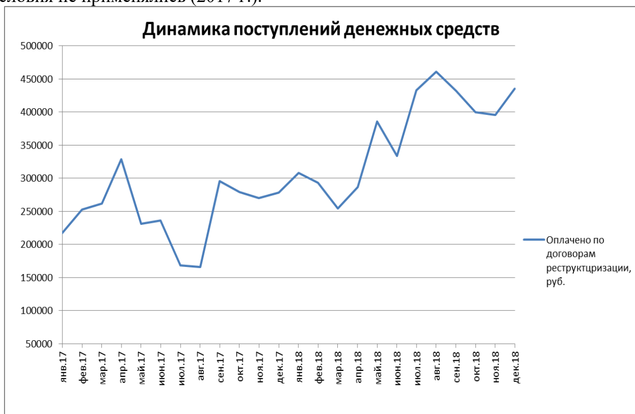
Рисунок 1 – Динамика поступления денежных средств по заключенным договорам реструктуризации за 2017–2018 гг.

2. Следующим из путей для уменьшения дебиторской задолженности является работа организаций по досудебному взысканию дебиторской задолженности с привлечением сил агентств по сбору коммунальных платежей.