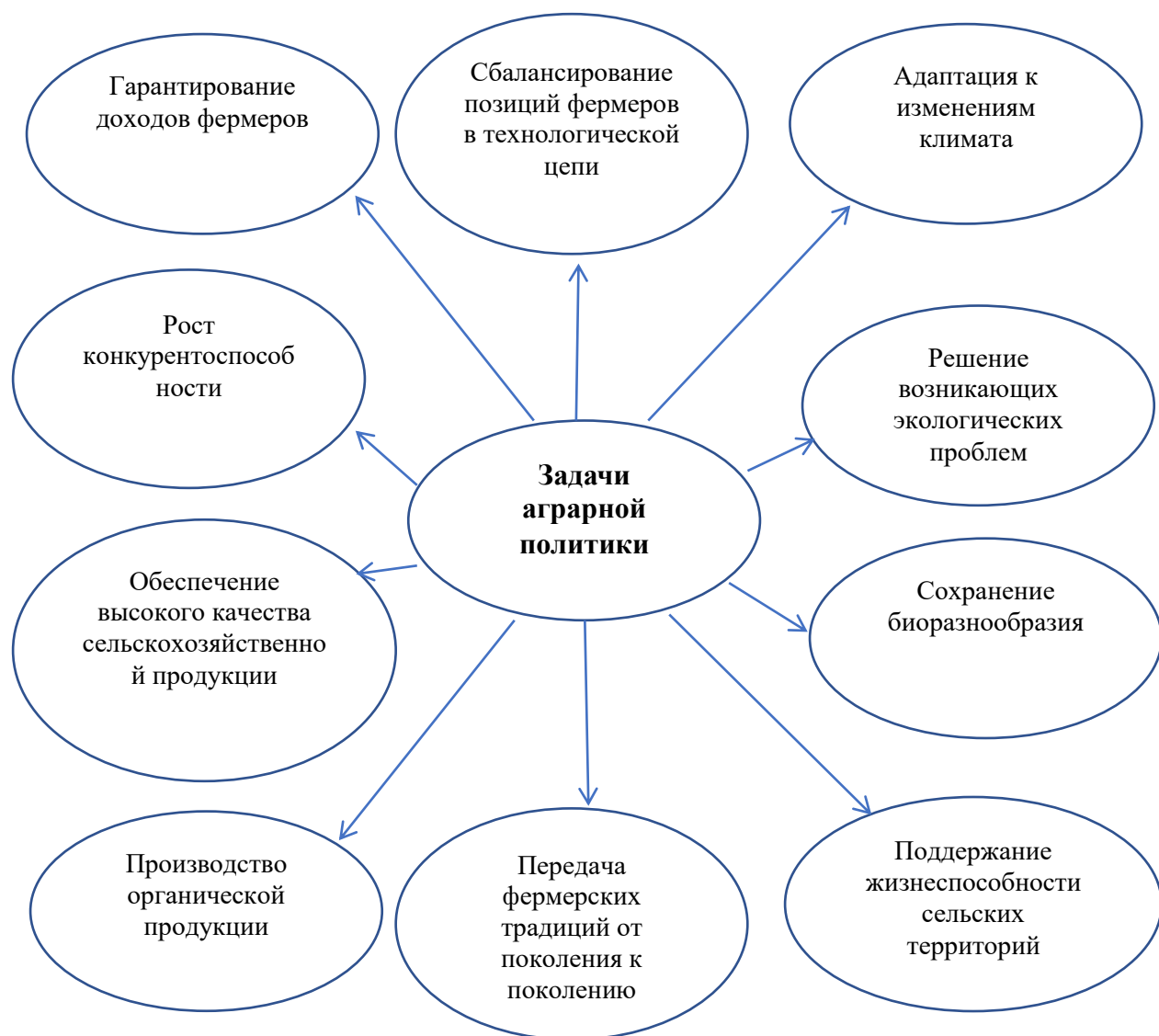
Рисунок 2 – Задачи современной аграрной политики относительно семейных фермерских хозяйств

Согласно данным задачам разработчики российской аграрной политики должны специфицировать субъекты государственной поддержки для каждого из отмеченных направлений, определить подходящие для решения задач инструменты, идентифицировать предполагаемые результаты, а затем разработать методики оценки эффективности реализуемой политики с целью постоянного мониторинга и корректирования её составляющих. В сложившейся на сегодняшний момент социально-экономической, политической и институциональной обстановке актуальными, безусловно, являются мероприятия, обращённые главным образом к мелким и средним фермерским хозяйствам, причём чаще всего к тем из них, которые определены в данном исследовании как крестьянские хозяйства и семейные фермерские хозяйства. Особый акцент при этом необходимо сделать на создании условий для молодых фермеров, в том числе тех, кто продолжает семейные фермерские традиции. Результаты такой политики будут иметь высокую значимость и неопределимые выгоды как субъектам государственной политики (фермерам), так и государству, и обществу в целом.