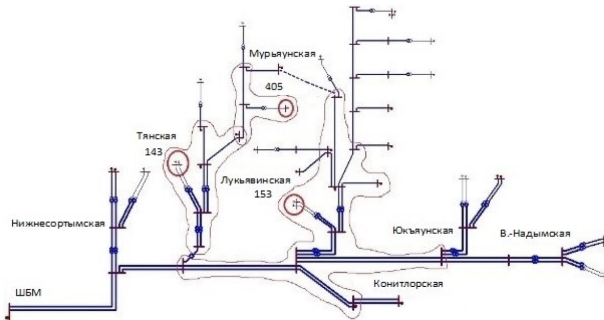
Рис. 2. Схема фрагмента распределительной электрической сети

Различные способы регулирования сравнивались по величине суммарного пропускания и потерь