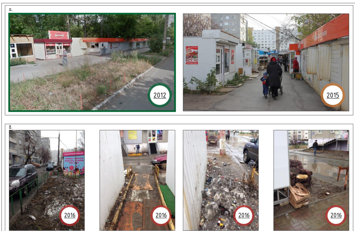
Рис. 5. Пример трансформации общественного пространства в микр. № 8 г. Челябинск: а) в течение 3 лет; б) в течение 5 месяцев.