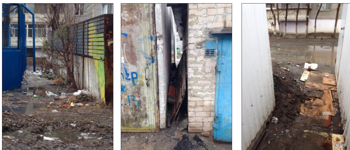
Рис. 1. Примеры маргинального пространства в микрорайоне № 8 г. Челябинск. Фото автора Зайцевой Т., 2016 г.

9) отсутствие административно-правового контроля.