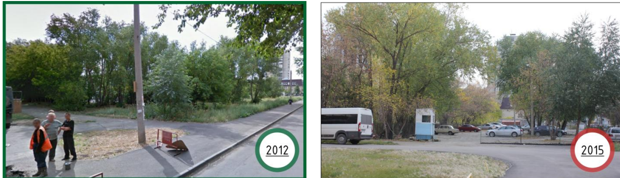
Рис. 3. Пример использования общественной территории под платную автопарковку.

Протекающие в микрорайоне негативные процессы являются предпосылками к утрате ценности жилой среды, нарушению целостности и связности территории, а в итоге – к формированию трущоб.