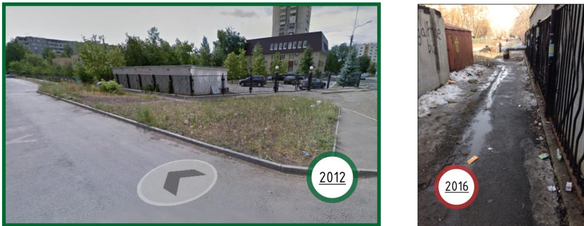
Рис. 4. Пример последствия изоляции пешеходных путей и приватизации общественного пространства

С точки зрения организации территории, трущобы обладают рядом характерных признаков: наличие обособленного сообщества, организующего поселение (на основе экономического, религиозного, национального, расового положения), расположение поселения на урбанизированной территории, но не признание его легальным (властями и городскими сообществами), высокая плотность населения, физическая изоляция от остальной части города [2].