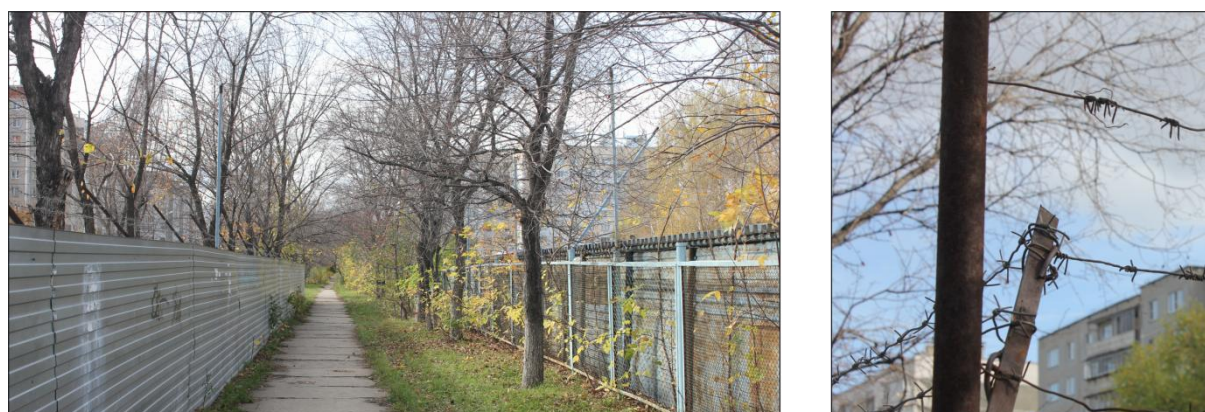
Рис. 2. Пример изоляции пешеходных путей двумя автостоянками по улице Захаренко, г. Челябинск. Фото автора Зайцевой Т., 2015 г.