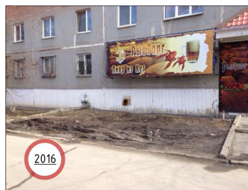
Рис. 6. Пример деградации озелененного пространства в микр. № 8 г. Челябинск. Фото 2012 г.: https://www.google.ru/maps , фото 2016 г. – автора Зайцевой Т.