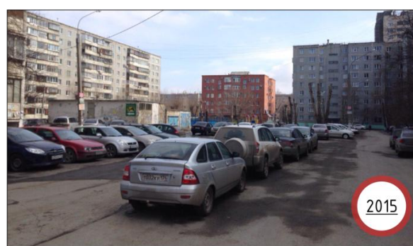
Рис. 7. Пример изменения уровня автомобилизации в микр. № 8 г. Челябинск.

Решения, принимаемые сегодня в микрорайонах, определяют не только их собственную судьбу, но и будущее города в социальном, культурном и экологическом планах.