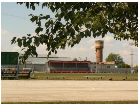
Рис. 7. Стадион «Нива».

В городе Варна, существует несколько исторически сложившихся мест такого назначения: площадь торгового центра, стадион (рис. 7), площадь Труда (рис. 9). Из новых можно отметить площадь перед торговым комплексом «Солнечный» (рис. 8), мини-спортивную площадку в новом микрорайоне города. Общедоступные пространства для посещений и мероприятий – каток на территории парка СХТ, площадь остановочного комплекса при СХТ, площадь перед ДШИ (рис. 10).