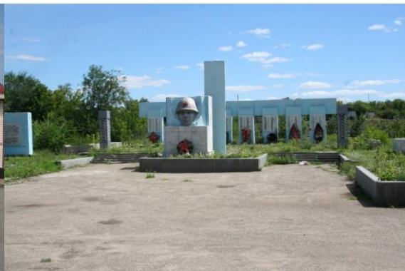
Рис. 4. Мемориал памяти.