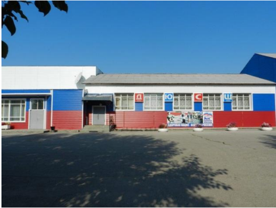
Рис. 1. Площадь перед МУДОД Детско-юношеской спортивной школой им. Ловчикова.