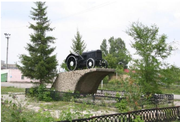
Рис. 5. Трактор «Фордзон».

Пространственные доминанты служат зрительными ориентирами, направляют внимание наблюдателя на главный элемент городской среды, иллюзорно увеличивают или уменьшают глубину городского пространства. При этом, в Варне в роли пространственных доминант выступают не только здания или строения, но и деревья, монументы. Например: Тополиная Аллея на улице Советской, памятник В.И. Ленину на привокзальной площади (рис. 6), памятник «Науки и техники», трактор «Фордзон» на площади перед СХТ (рис. 5).