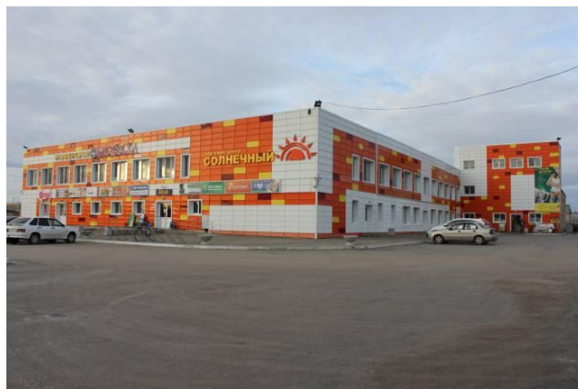
Рис. 8. Площадь перед ТК «Солнечный»