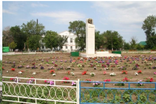
Рис. 6. Памятник В. И. Ленину на привокзальной площади.