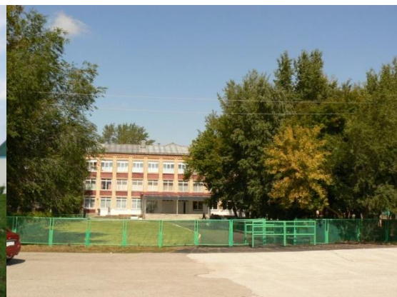
Рис. 12. Площадь перед старейшей МОУ СОШ № 1.