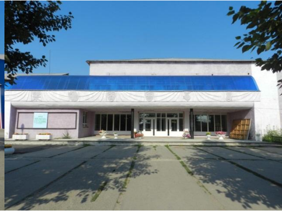
Рис. 2. Площадь перед РДК «Планета».