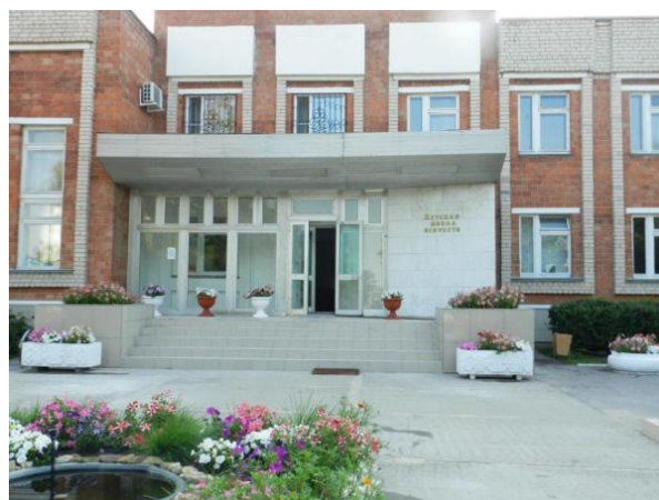
Рис. 10. Площадь перед зданием Детской Школы Искусств.