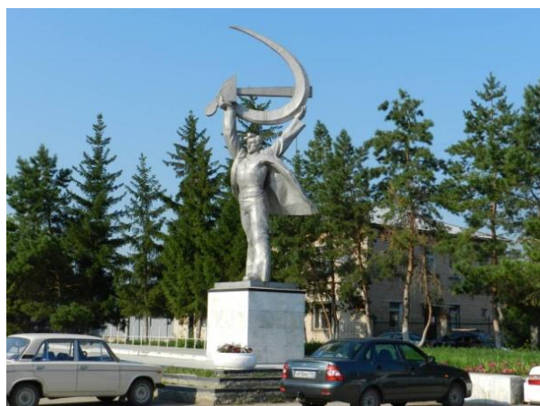
Рис. 9. Скульптура «Слава труду» на площади Труда.