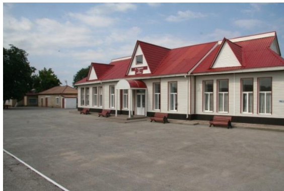
Рис. 3. Привокзальная площадь.