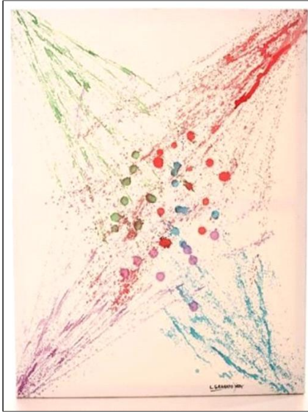
Рис. 2. Гранато Леандро

вергла многих зрителей в шок. Попав на такое представление, задумываешься – искусство это? – нет, нет и ещё раз нет. Публика удивлена и шокирована? – да! Это красиво? – нет, но то, что это никакое, бессмысленное и безобразное и лучше все это обойти стороной – это да.