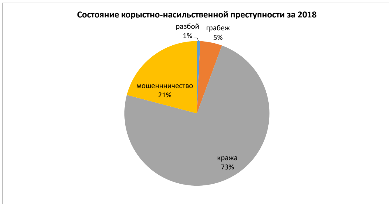
Рисунок А1. Состояние корыстно-насильственной преступности в соучастии за 2018 год.