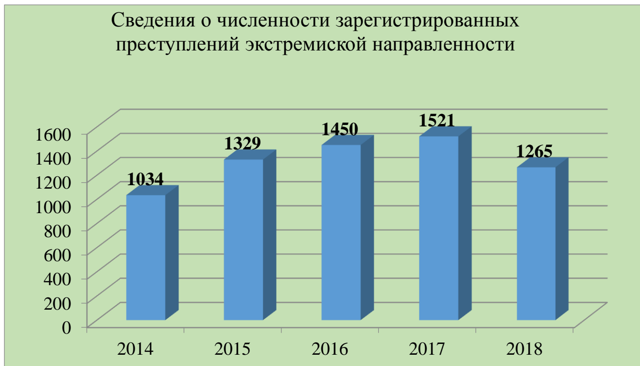
Рисунок Б.1 – Сведения о динамике численности преступлений экстремистской направленности