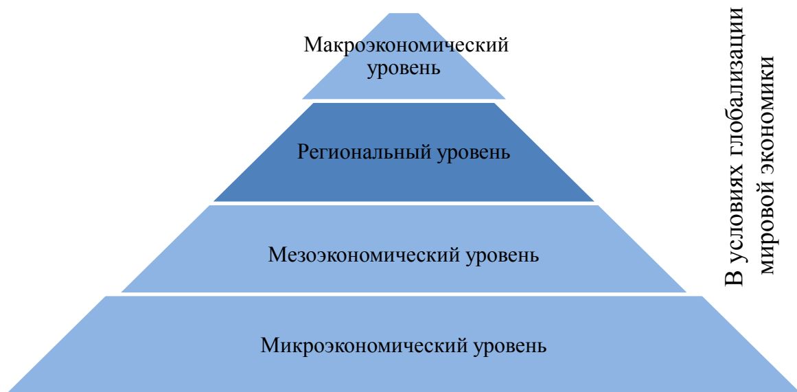
Рис. 2. Уровни реализации прогнозов формирования и управления предпринимательскими структурами

Исходя из ситуации глобализации мирового рынка товаров и услуг на мезоуровне необходимо выполнять следующие управленческие действия: