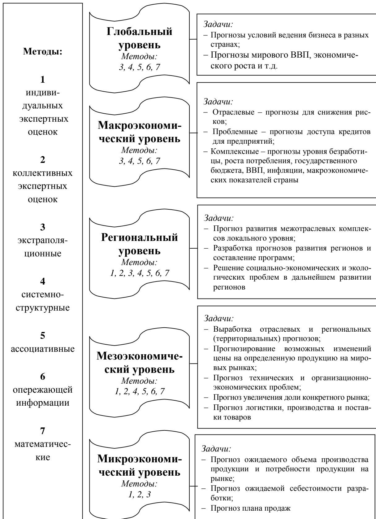
Рис. 3. Взаимосвязь уровней управления и методов прогнозирования развития предпринимательских структур