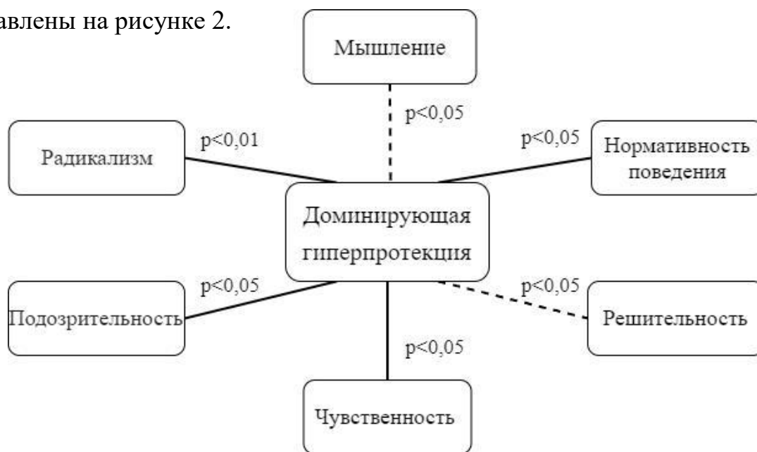
Рис. 2. Взаимосвязи между типом семейного воспитания «доминирующая гиперпротекция» и личностными особенностями родителей в полных семьях.

Взаимосвязи между типом семейного воспитания «доминирующая гиперпротекция» и личностными особенностями родителей в полных семьях представлены на рисунке 2.