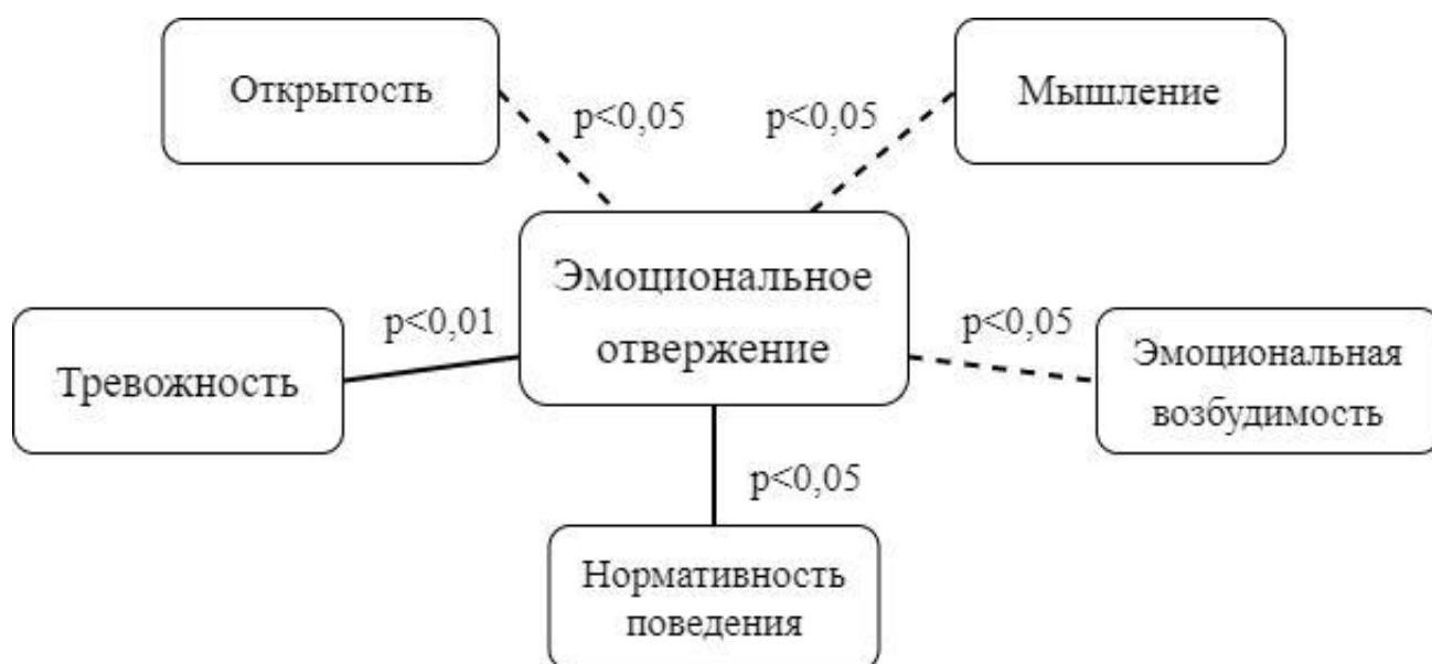
Рис. 4. Взаимосвязи между типом семейного воспитания «эмоциональное отвержение» и личностными особенностями детей в полных семьях.

Выявленные взаимосвязи между типом семейного воспитания «эмоциональное отвержение» и личностными особенностями детей в полных семьях представлены на рисунке 4.