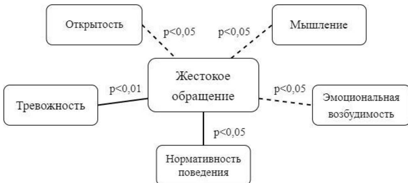
Рис. 5. Взаимосвязи между типом семейного воспитания «жестокое обращение» и личностными особенностями детей в полных семьях.

Обнаруженные значимые взаимосвязи типа семейного воспитания «жестокое обращение» с личностными особенностями детей в полных семьях представлены на рисунке 5.