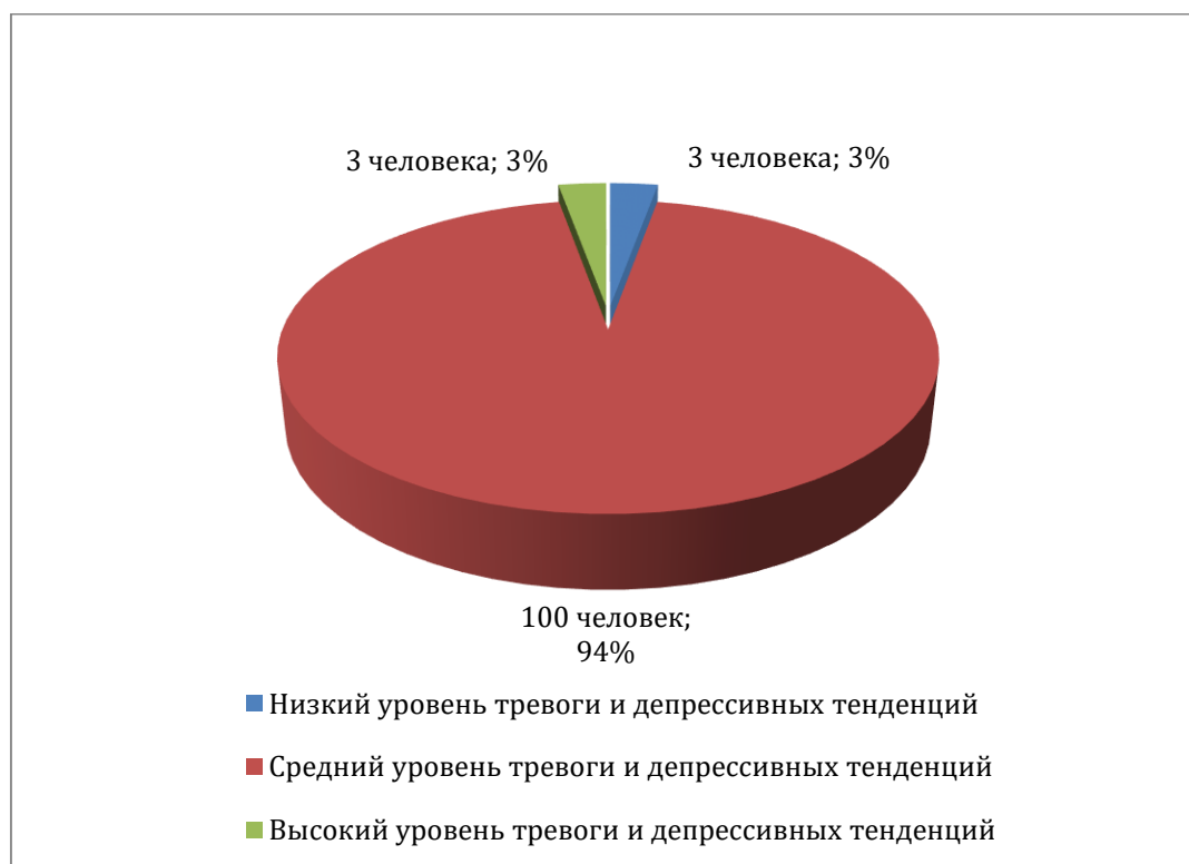
Рисунок 2 – Распределение испытуемых по уровням тревоги и депрессивных тенденций

Полученные данные распределения уровней склонности к тревоге и депрессивным тенденциям по шкале тревоги и депрессивных тенденций методики ММИЛ (Ф.Б. Березин и М.П. Мирошников) в процентном соотношении представлены на рисунке 2.