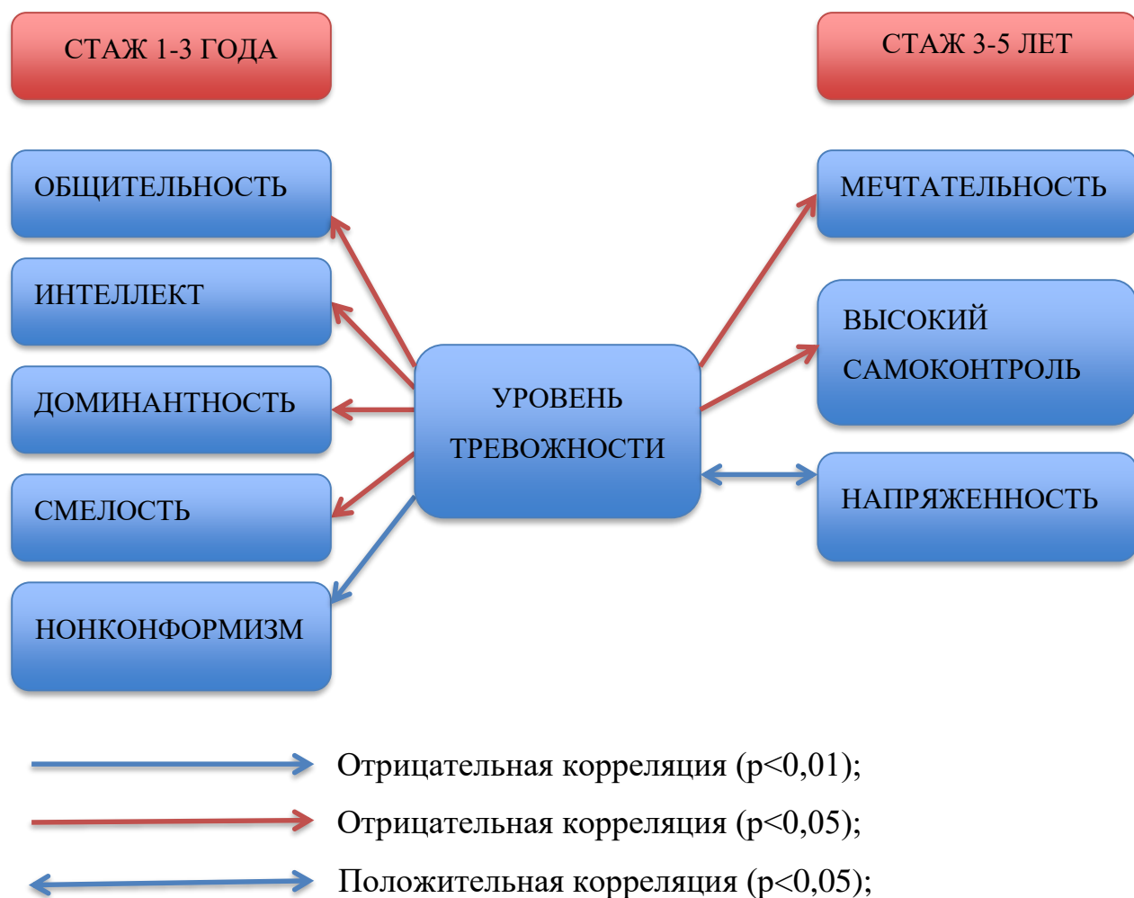
Рисунок 6 – Взаимосвязи уровней тревожности и личностных качеств сотрудников газо-дымозащитной службы с разным стажем работы

Таким образом, как видно из рисунка, взаимосвязи уровня тревожности и личностных качеств сотрудников газо-дымозащитной службы зависят от стажа работы.