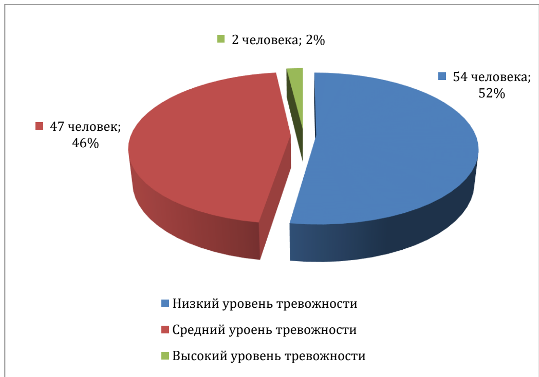
Рисунок 1 – Распределение испытуемых по уровням тревожности

Как видно на рисунке, для большинства испытуемых (54 сотрудника из 103; 52%) характерен низкий уровень тревожности как личностного свойства.