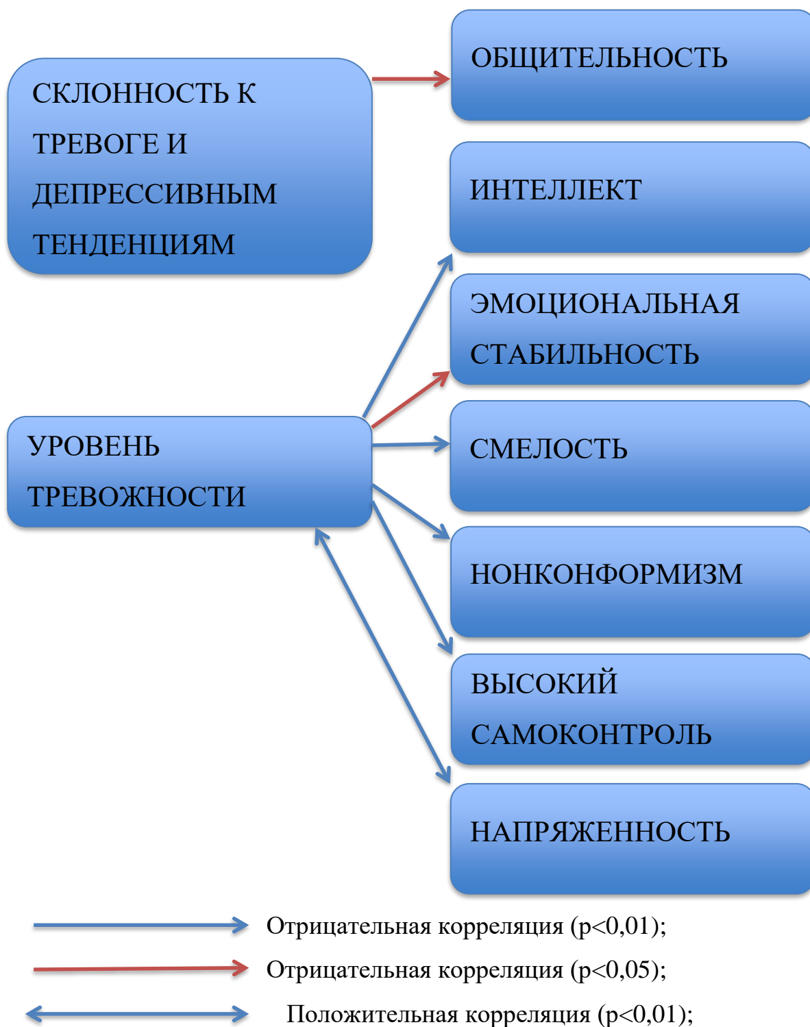
Рисунок 3 – Взаимосвязи уровней тревожности и личностных качеств сотрудников газо-дымозащитной службы

Полученные взаимосвязи уровней тревожности и личностных качеств сотрудников газо-дымозащитной службы представлены на рисунке 3.