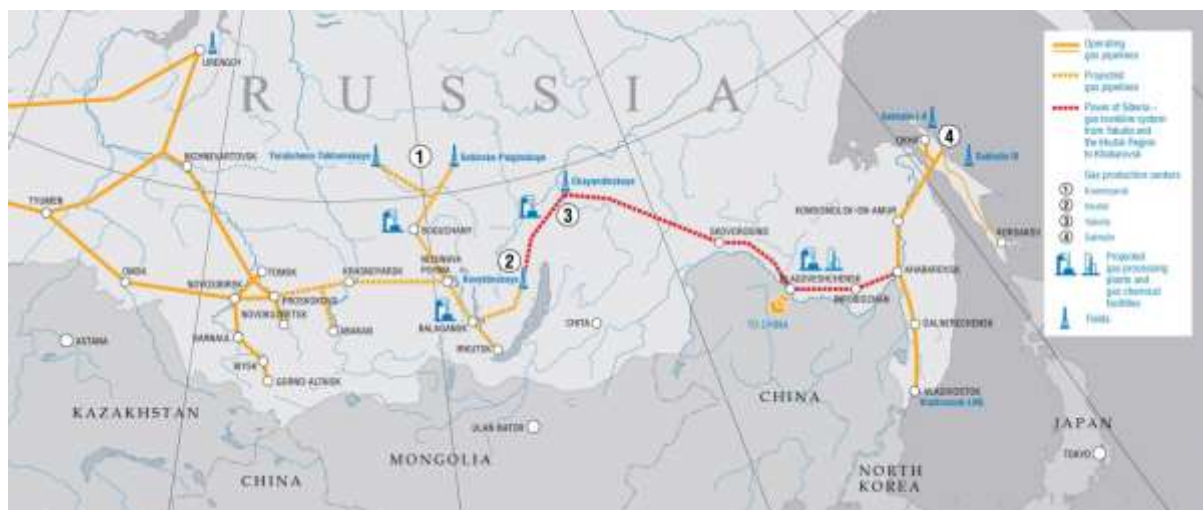
Рисунок 1. Разработка газовых ресурсов и формирование газотранспортной системы на востоке России

Торговля с Китаем составляет значительную долю в общем объеме торговли России, в то время как для Китая это лишь небольшая доля в общем объеме торговли. Экспорт из России в Китай, является главным образом сырьевым, а ее импорт из Китая — это в основном продукция с высокой добавленной стоимостью. Это ясно указывает на то, что Россия постепенно становится ресурсом, примыкающим к Китаю, и некоторые российские эксперты описали характер торговли как «неоколониальный» 58 .