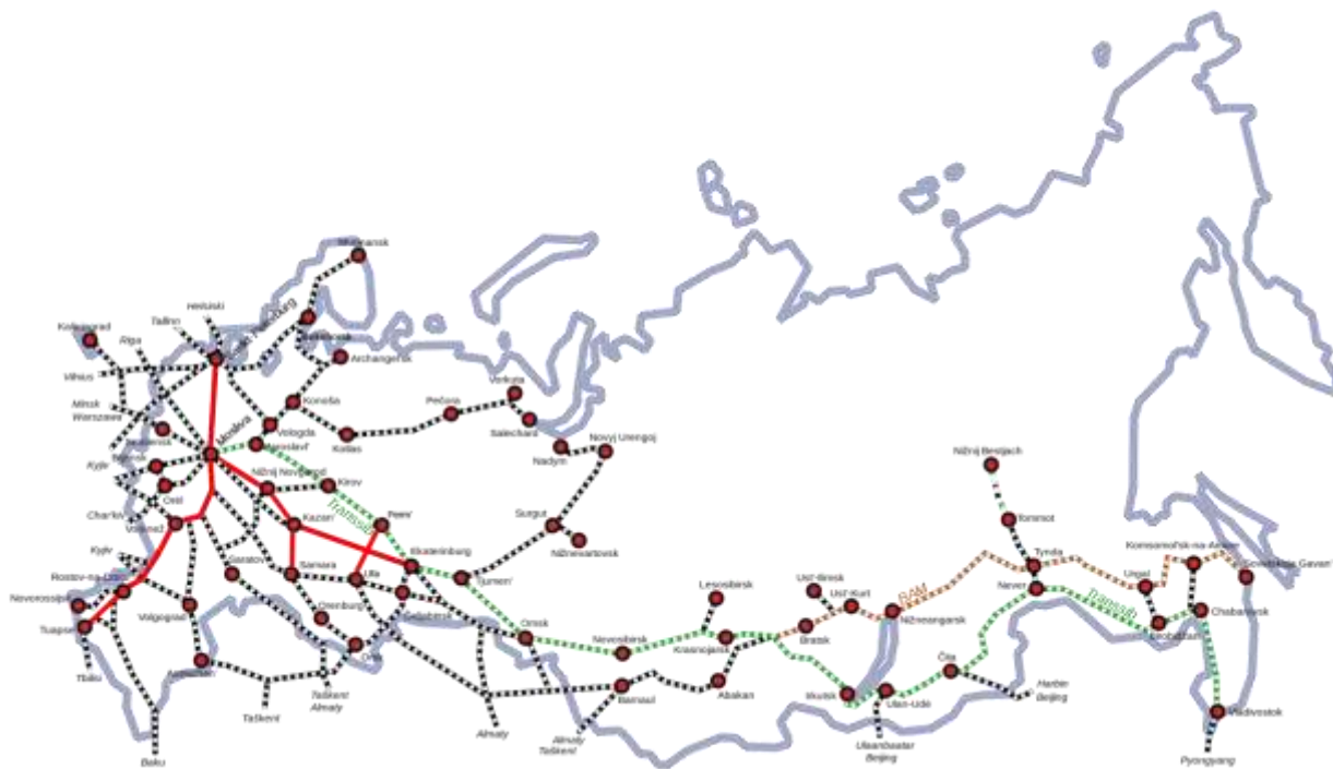
Рисунок 3. Транспортные магистрали России

экспорт из региона. Помимо добычи ресурсов, эти факторы могли бы повысить привлекательность региона для Китая и способствовали бы большей трансграничной торговле и местному экономическому росту. Модернизация транспортной инфраструктуры является одним из приоритетных направлений Программы развития Дальнего Востока России.