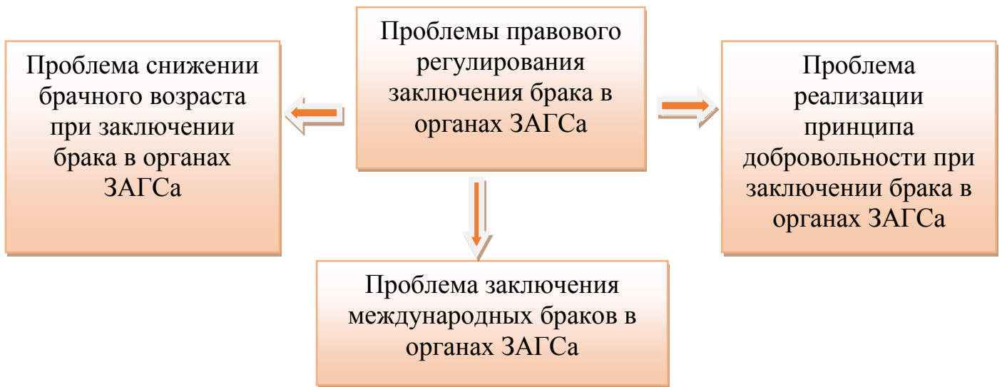
Рисунок А.1 – Проблемы правового регулирования заключения брака в органах ЗАГС