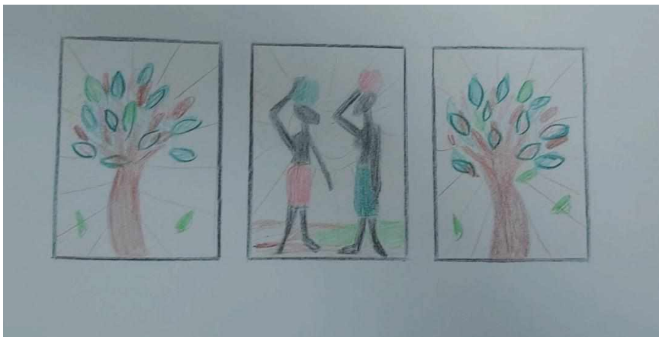
Рисунок 13 — Эскиз декоративного панно

Декоративное панно, выполненное в технике лоскутного шитья. Оно предназначено для оформления интерьера квартиры, кафе или мягких ресторанов. Панно состоит из трех частей, размер каждой части 50×70 см. На задней части оформлена кулиска для крепления. Эскиз представлен на рисунке 13.