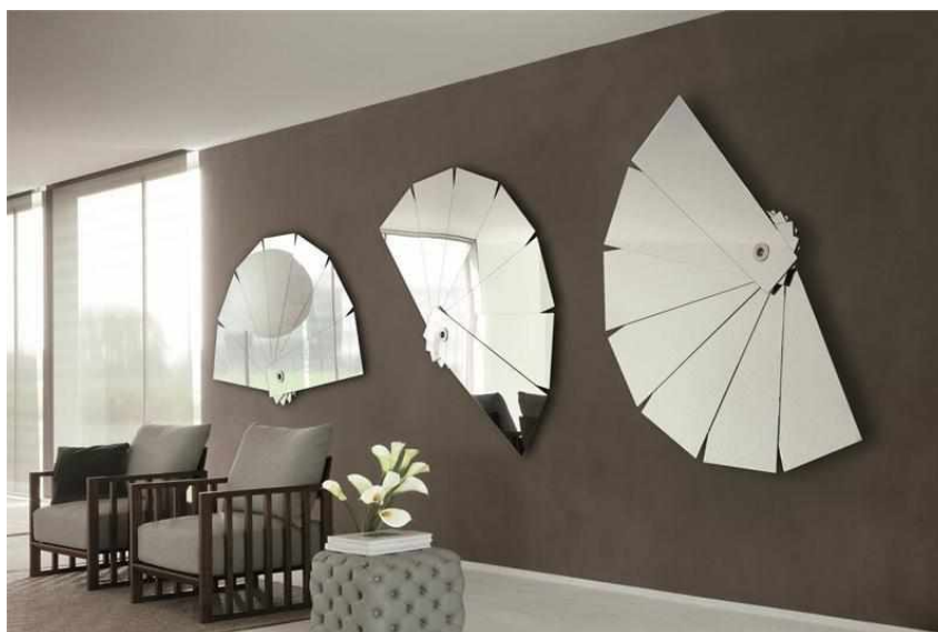
Рисунок 7 — Необычные зеркала