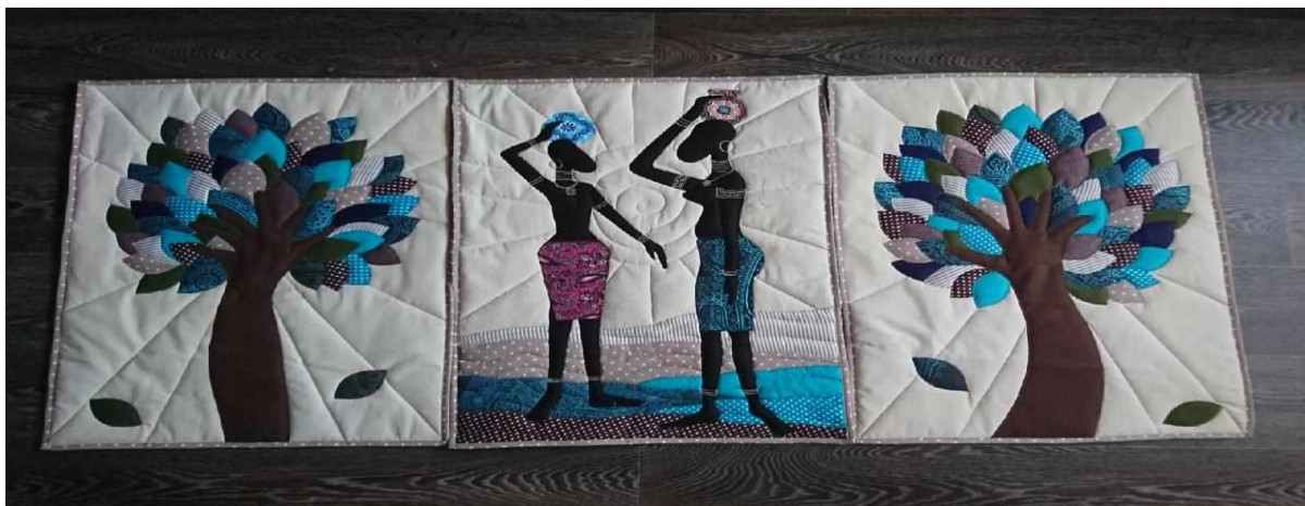
Рисунок 14 — Готовое изделие