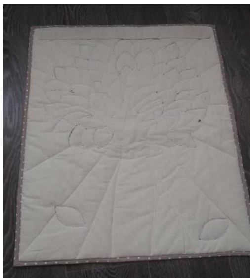
Рисунок 15 — Вид сзади