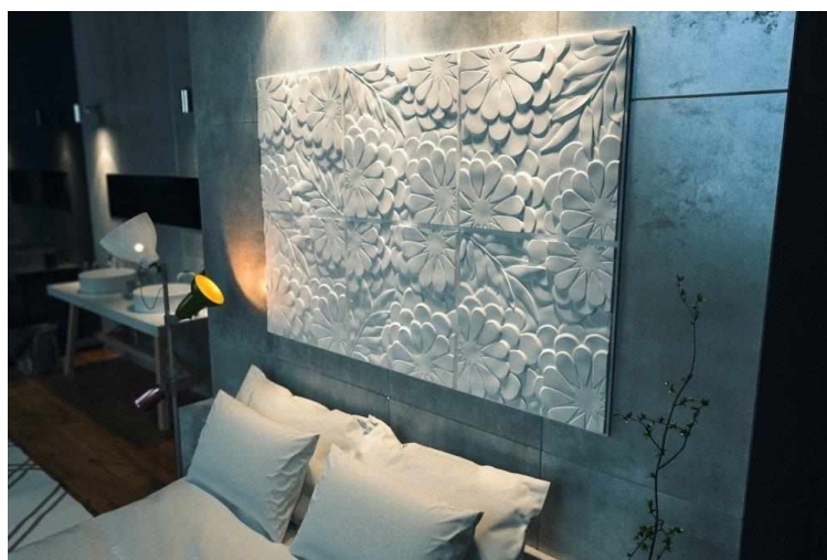
Рисунок 12 — Пластиковое панно

Пластиковые. Пластиковые панно больше напоминают фотообои. Они популярнее остальных видов из-за своей долговечности и разнообразия. Хотя они лишены индивидуальности, что часто является серьезным препятствием для опытных дизайнеров, предпочитающих оригинальные приемы (рисунок 12).