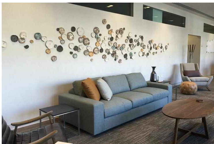
Рисунок 11 — Керамическое панно

Керамические. Керамические панно собираются прямо на стене. Они могут выглядеть отдельными элементами или обретать нечеткие цельные формы. Главным преимуществом является влагостойкость, позволяющая использовать декор в ванной комнате без ограничений и дополнительных работ (рисунок 11).