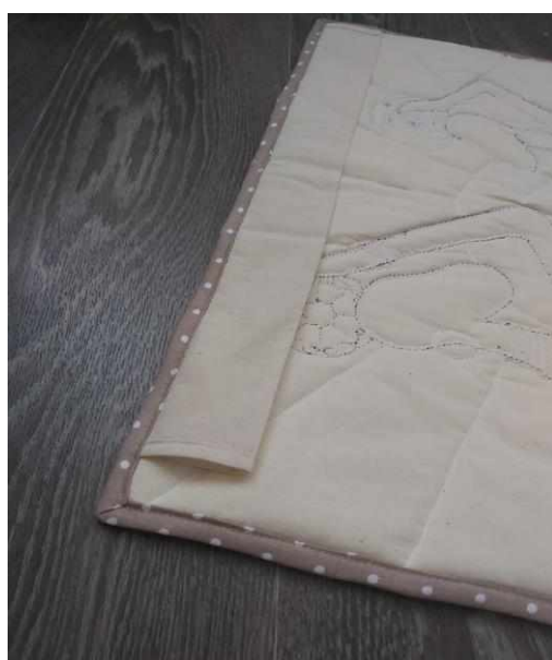
Рисунок 16 — Оформление крепления