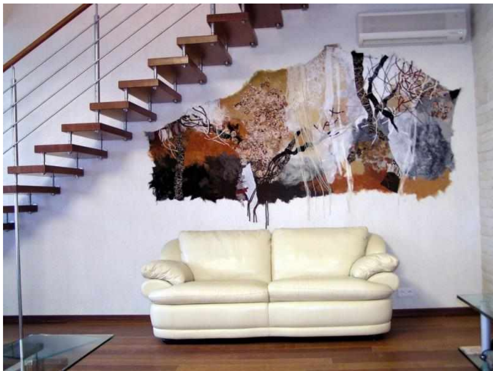
Рисунок 5 — Декоративное панно

Очень интересным вариантом являются наборы декоративных панно, которые вешаются на стены в виде ансамбля. Такое решение позволяет декорировать стену полностью, без применения других элементов (рисунок 5).