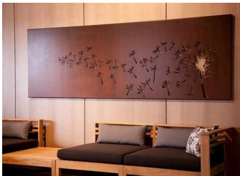
Рисунок 9 — Деревянное панно

создается цельная картина с определенным сюжетом и естественностью (рисунок 9).