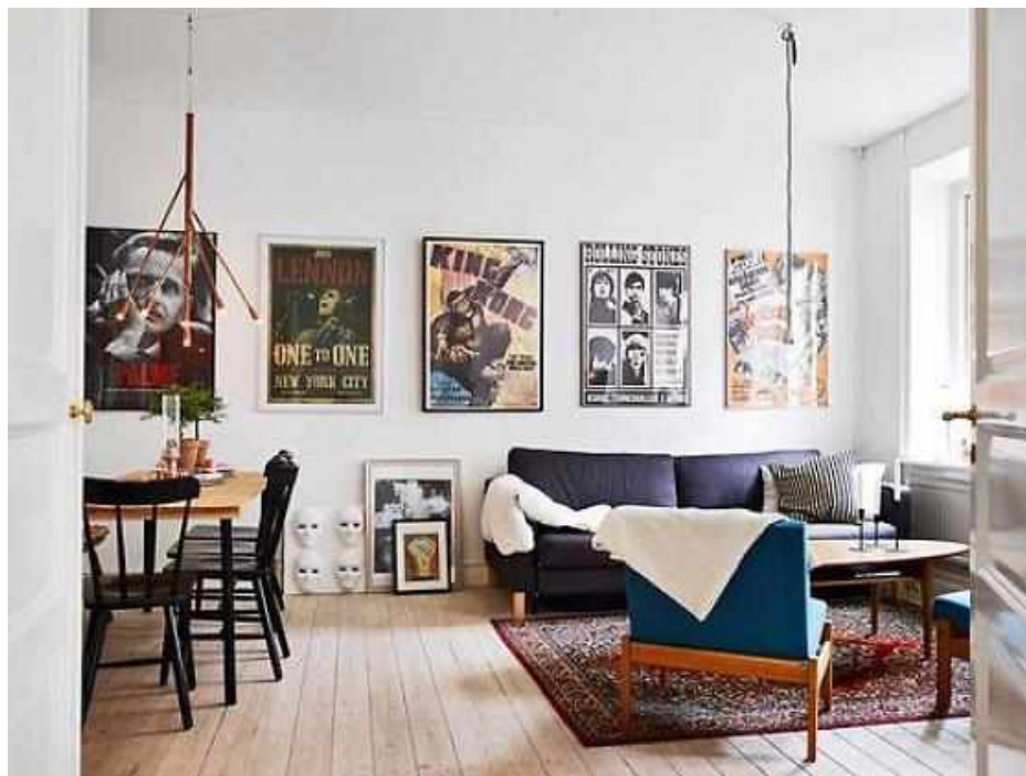
Рисунок 2 — Плакаты и постеры

При выборе постера важно обращать внимание на его сюжет — для спальни или детской лучше выбирать наиболее спокойное решение. А на кухне уместны постеры с изображениями пищевых продуктов или с другим приятным глазом изображением (рисунок 2).