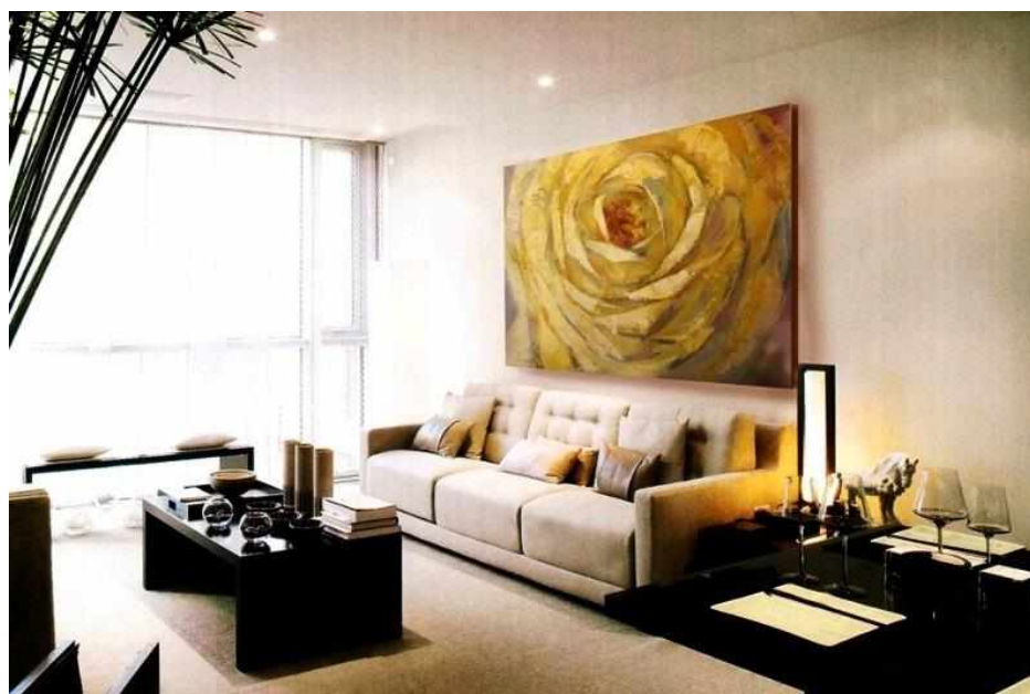
Рисунок 4 — Картина

Картины в стиле авангардизма и импрессионизма прекрасно подойдут для современных интерьерных решений. Важно, чтобы тона картин перекликались с цветовым оформлением интерьера (рисунок 4).