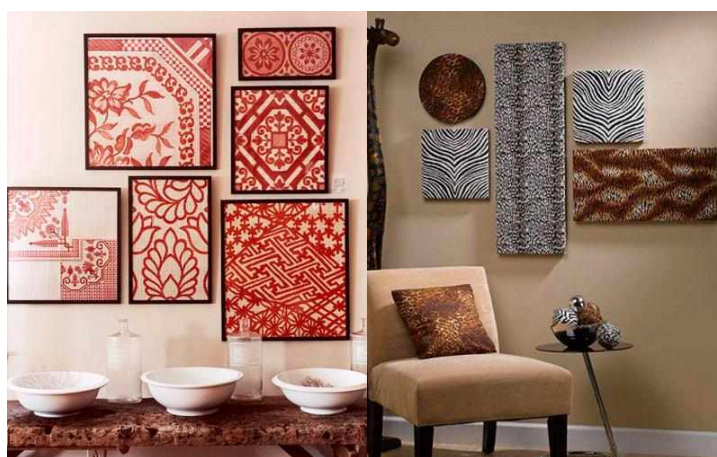
Рисунок 8 — Тканевые панно

Тканевые. Тканевые панно — древние украшения, создаваемые посредством аппликации или вышивки на полотне. Сейчас популярностью пользуются гобелены, изготавливаемые ручным или машинным способом. Они обладают исторической красотой, внося в интерьер неожиданное разнообразие (рисунок 8).