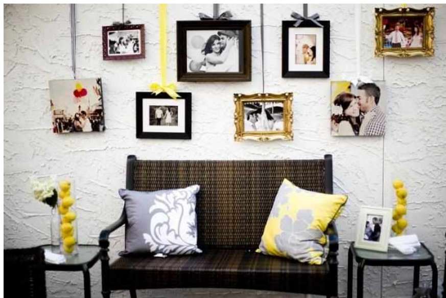
Рисунок 3 — Фотографии в рамках

Картины. Художественный стиль развивался наряду с интерьером и архитектурой. Поэтому для каждого стиля найдется вариант декора стен картинами. В традиционных стилях прекрасно проявят себя качественные репродукции известных художников.