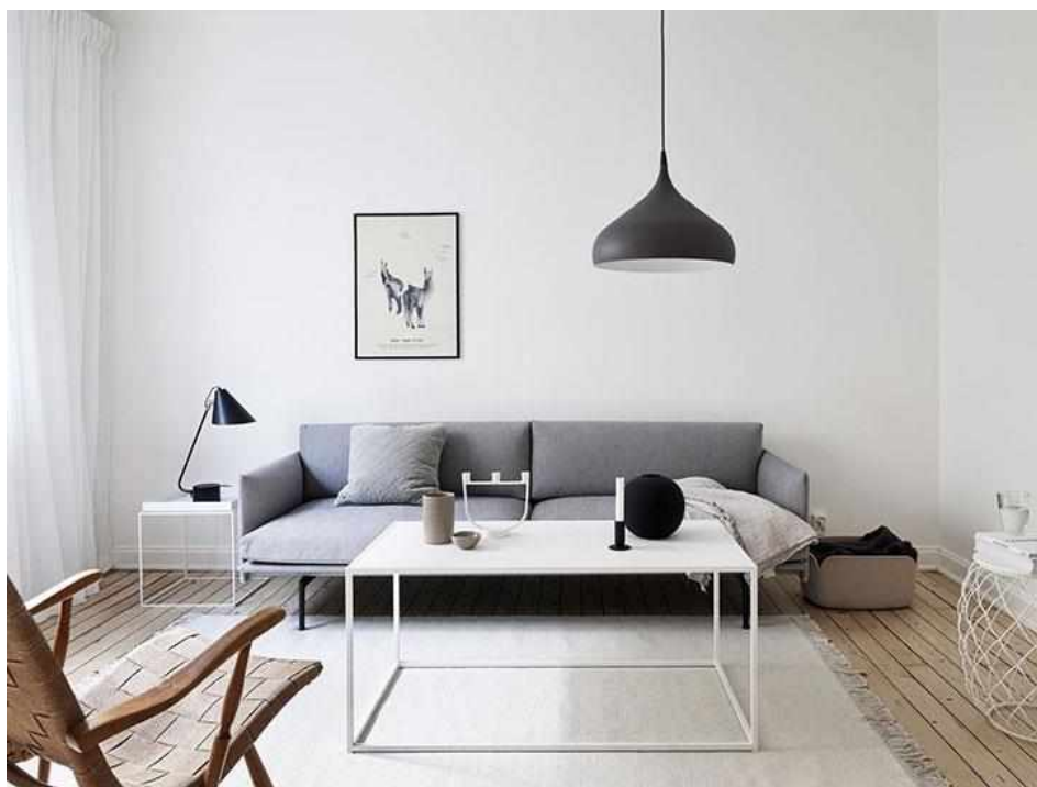
Рисунок 1 — Декор 2019 года

В прошлом году был актуален минималистичный декор стен, который становился основой для расстановки акцентов (рисунок 1). В 2020 году, хоть и не принципиально, но меняется дело. Актуален выразительный декор.