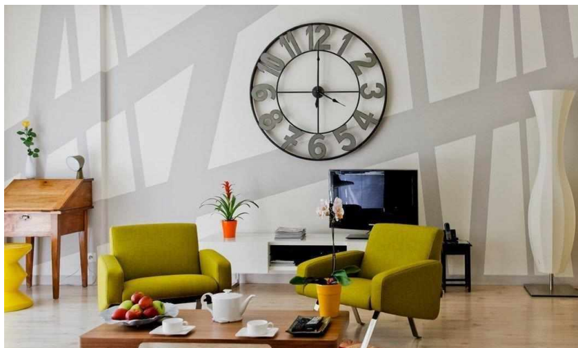
Рисунок 6 — Оригинальные часы