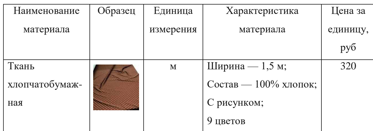
Таблица 2.4 — Ведомость материалов

Ведомость материалов представлена в таблице 2.4.