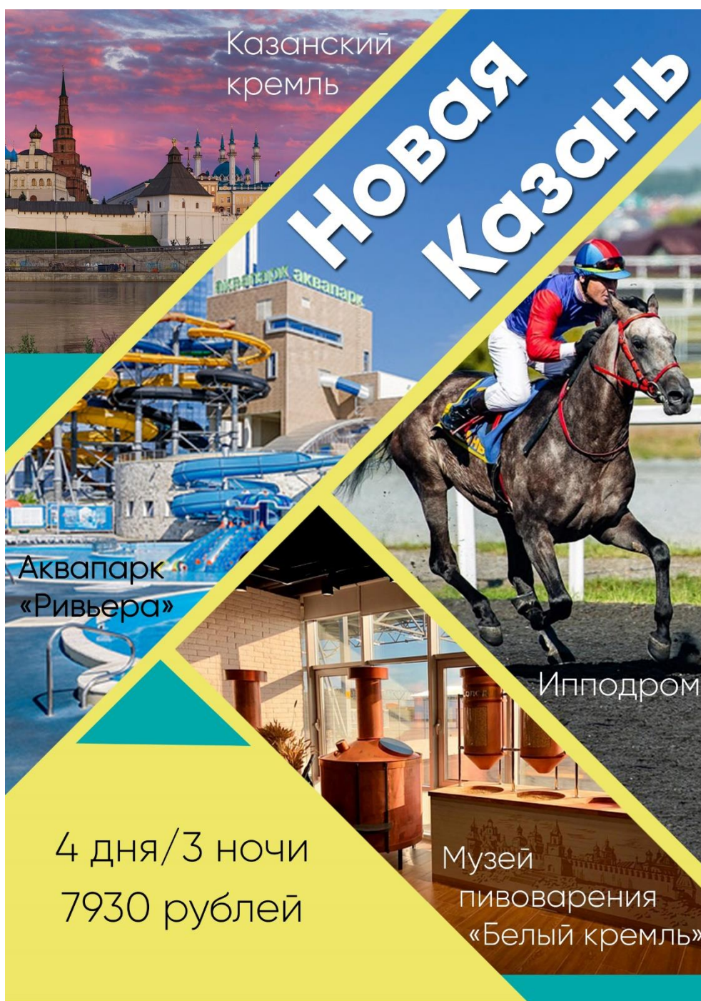
Рисунок В.1 – Рекламный баннер