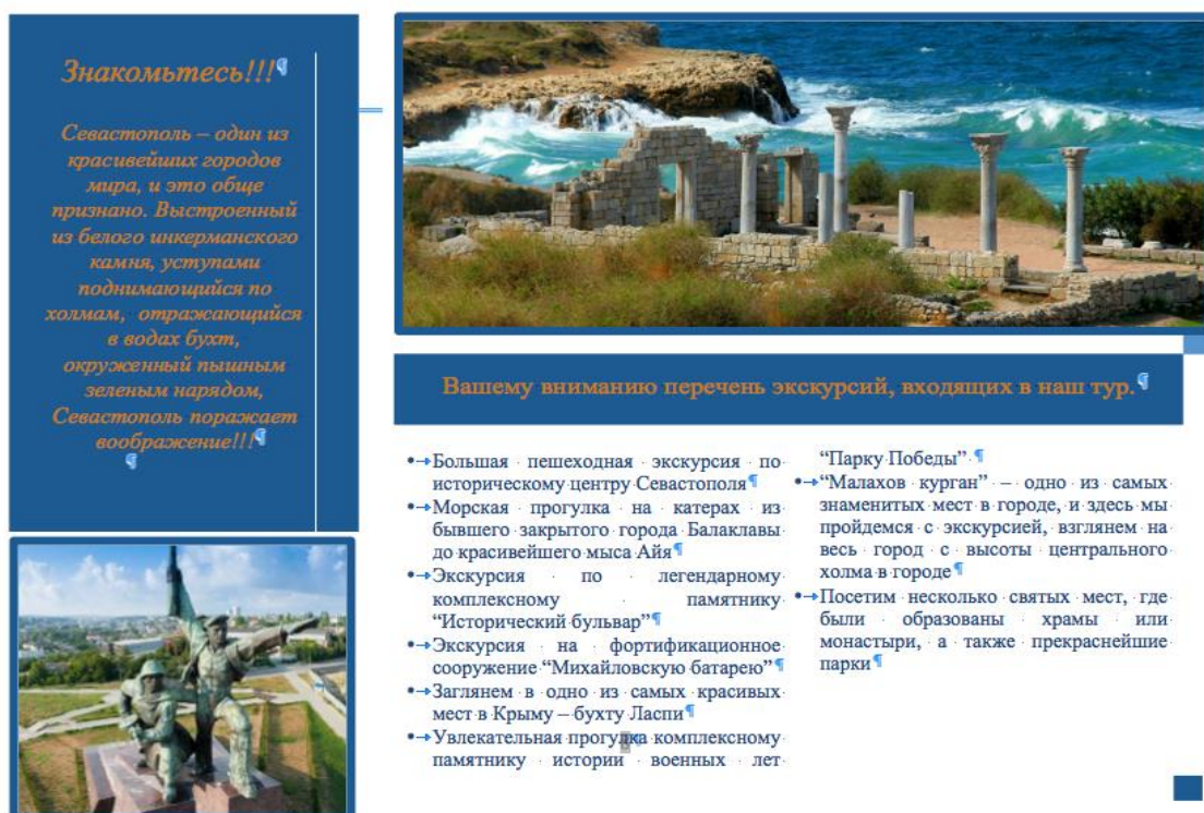
Рисунок Г.2 – Внутренняя сторона рекламного буклета