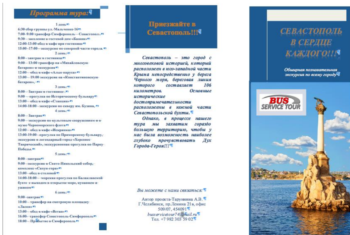
Рисунок Г.1 – Лицевая сторона рекламного буклета