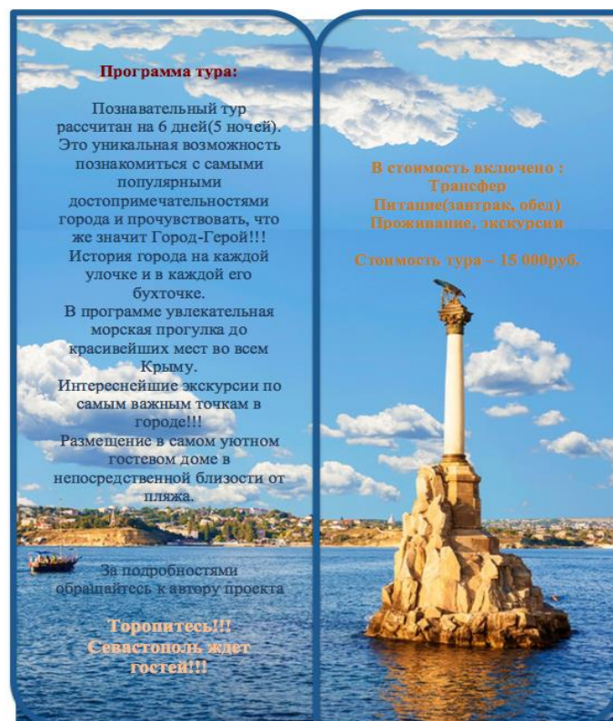
Рисунок Г.4 – Внутренняя сторона рекламной листовки