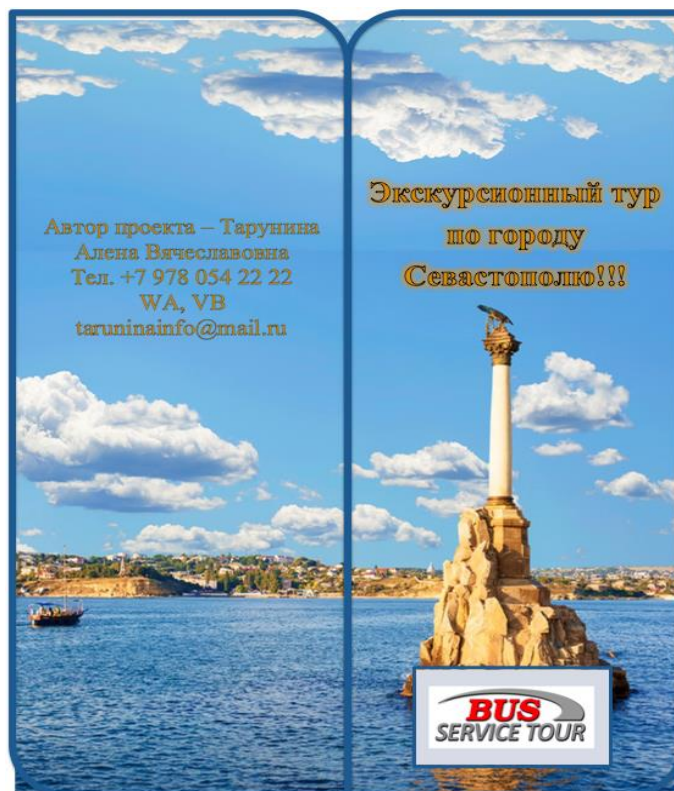
Рисунок Г.3 – Лицевая сторона рекламной листовки