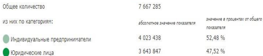
Рис. 1.1 – Распределение действующих юридических лиц и индивидуальных предпринимателей (по состоянию на 31 мая 2020 г.)