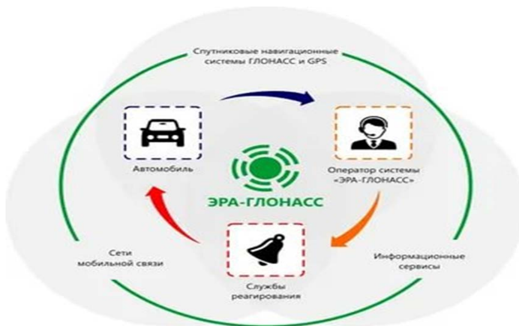
Рисунок 2 – Процесс экстренного реагирования при авариях с помощью системы «ЭРА – ГЛОНАСС»

принципу «виртуального оператора») и устройства (автомобильная система в терминах стандарта), устанавливаемые в автомобили. На (рисунке 2) изображен процесс экстренного реагирования при авариях с помощью системы ЭРА – ГЛОНАСС.