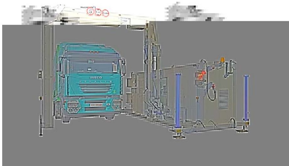
Рисунок 3 – Инспекционно-досмотровый комплекс

Порядок работы ИДК регламентирован Приказом ФТС от 09.12.2010 г. № 2354 «Об утверждении инструкции о действиях должностных лиц таможенных органов при таможенном контроле товаров и транспортных средств и использованием инспекционно-досмотровых комплексов». ИДК обладает тактико-техническими характеристиками, обеспечивающими: