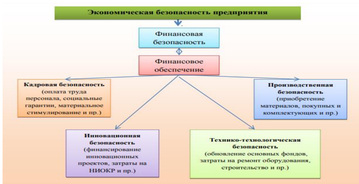
Рисунок 1.1 – Схема обеспечения экономической безопасности через финансовое обеспечение

В вопросах реализации экономической безопасности предприятия особое значение отводится финансовому обеспечению, то есть безопасности. Зарубежные и российские методики оценки уровня экономической безопасности. Рассматривая связь экономической безопасности с финансовым обеспечением, А.Е. Суглобов указывает, что экономическая безопасность понимается как совокупность действий по обеспечению максимально высокого уровня платежеспособности и ликвидности оборотных средств, а также повышению уровня стратегического и оперативного планирования, управления производственными и интеллектуальными ресурсами 8 . На рисунке 1.1 представлена схема обеспечения экономической безопасности через финансовое обеспечение.