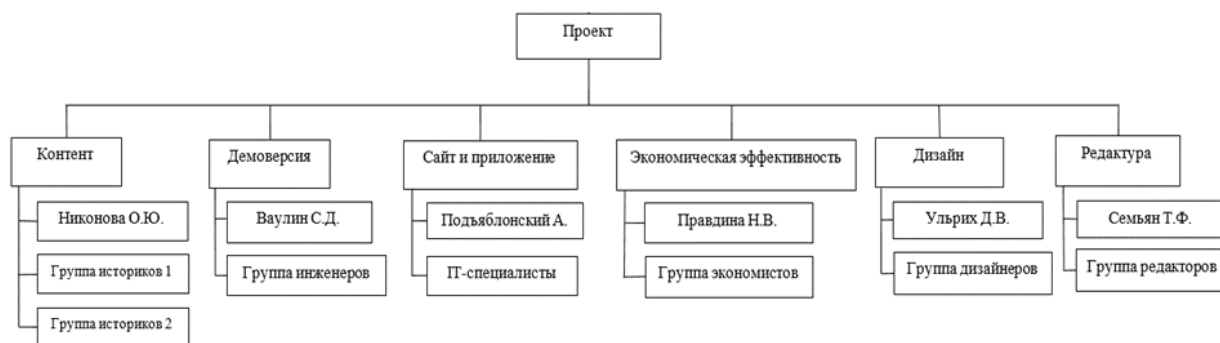
Рисунок.1 – Организационная структура управления проектом

Организационная структура управления проектом представлена на рисунке 1.