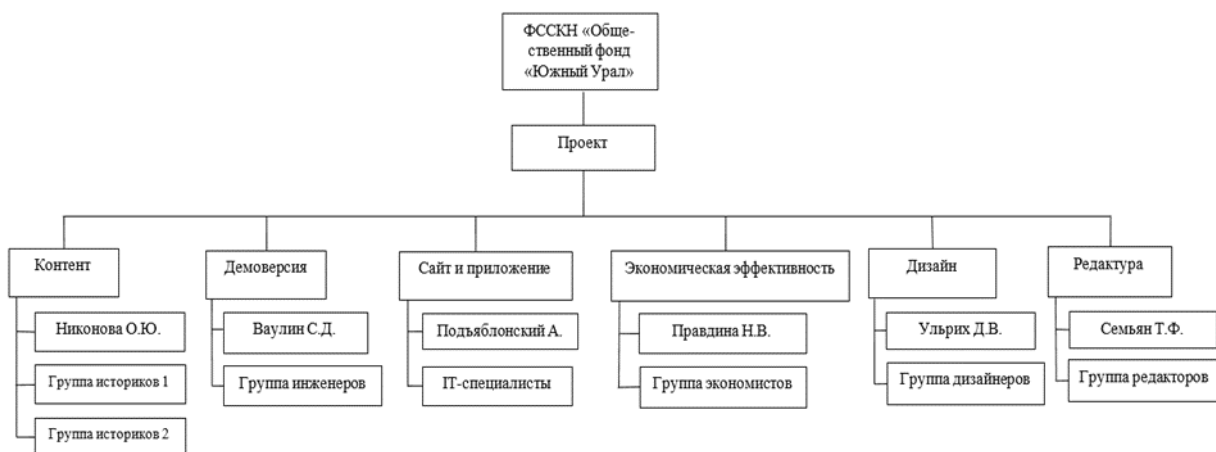
Рисунок 2 – Организационная структура управления проектом

Проектная деятельность имеет свою организационную структуру. Организационная структура управления – совокупность специализированных функциональных подразделений, взаимосвязанных в процессе обоснования, выработки, принятия и реализации управленческих решений. В проекте была принята функциональная организационная структура управления, которая подразумевает «одно подразделение – одна функция». Организационная структура управления проектом представлена на рисунке 2.