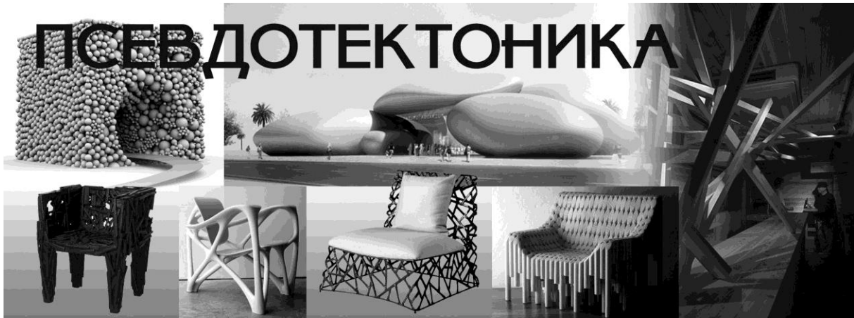
Рис. 5. Псевдотектоника

Через термин «бутафория», отражающий принцип формообразования псевдотектонических произведений архитектуры и дизайна, логично выйти на понятия «театральность», «игра», и тогда становится ясной связь этих явлений с эстетикой постмодернизма в целом [2].