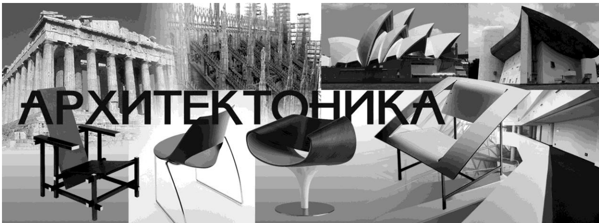
Рис. 2. Архитектоника

Особенно важен вопрос различения понятий «тектоника» и «архитектоника». Беглое филологическое сравнение терминов сразу подсказывает, что между ними лежит та грань, которая отделяет «строительное искусство» от архитектуры как искусства просто, без уточняющей приставки. По-видимому, именно на границе этих понятий архитектура становится «музыкой, застывшей в камне».