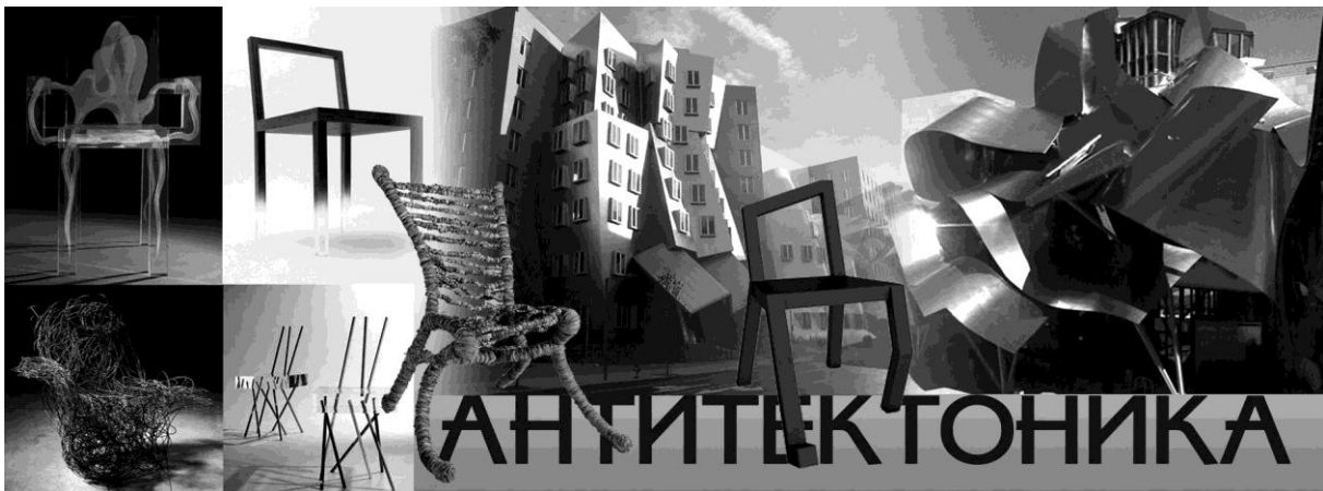
Рис. 4. Антитектоника

Антитектоника («против» тектоники) – нарушение конструктивной логики, игнорирование физических законов (рис. 4).