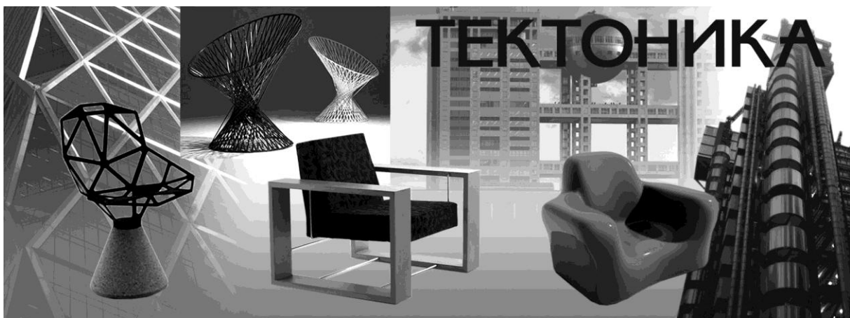
Рис. 1. Тектоника

Тектоника – зримое выражение во внешней форме объекта его конструктивной структуры, внутреннего строения (рис. 1).